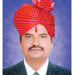
હિંમતનગર તેમજ ખાનગી કોવિડ હોસ્પિટલમાં સારવાર લઈ રહ્યા છે. નાનાયેબલાના અને પ્રાંતિજ એસ.ટી. ડેપોમાં ફરજ બજાવતા કોરોનાથી સંક્રમિત થતાં સ્થાનિક સારવાર શરૂ કરી પરંતુ તબિયત વધુ લથળતાં હિંમતનગર સિવિલમાં ખસેડવામાં આવ્યા હતા.

વધુ લોકોના મોત નિપજ્યા છે. આ વિસ્તારના કેટલાક લોકો સંક્રમિત થઈ