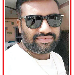
વસંત પ્રજાપતિ બાયડ, ત્રિ. અરવલ્લી