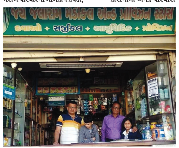
ચપ્પલ, સુકોમેવો આપવાનો હોય, ભરબાદ થઈ ગયા છે. દવાઓના મોંઘાદાટ બીલ અને પરિવારના સભ્યને હોસ્પિટલમાં સારવાર એમ

પરિવારના સંતાનોને સાક્ષર કરવાના હોય તેમાં તેમના યોગદાનને ક્યારેય નજર અંદાજ ન કરી શકાય. કોરોનામાં અનેક પરિવારો