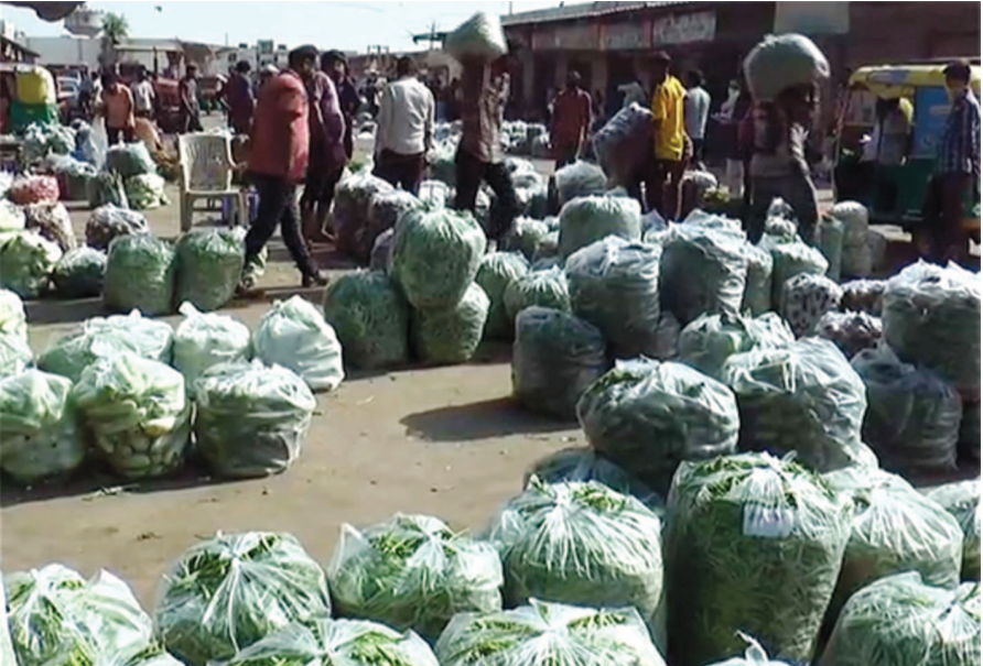
લોકડાઉન અને ગુજરાત સાથેની તમામ સરહદો સીલ થવાના કારણે સાબરકાંઠા, અરવલ્લીમાંથી અન્ય શાકભાજી પકવતા ખેડૂતો કોરોના કાળમાં પાયમાલ બનવાની દહેશત છે. ખેડૂતોના આંગણે અને શાકભાજી વેચવાની ફરજ પડી છે અને લેભાગુ વેપારીઓ ઓછા ભાવે શાકભાજી ખરીદી પ્રજાને વધુ

સામનો કરવો પડે છે. શાકભાજીના ભાવમાં ૫૦ ટકા ઘટાડો થવા છતાં ત્રણ ગણા ભાવથી શાકભાજી વેચી કમાણી કરી રહ્યા છે. કેટલાક સેવાઓમાં આવતી હોવાથી ગુજરાત સરકારે અન્ય રાજ્યો સાથે