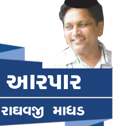
આરપાર રાઘવજી માધડ

ઓહું, અધૂરું ને વામણું લાગે. તેમનો '૩' ઉજવવો તે સૂરજ સામે દીવડો ધરવા જેવું લાગે! અમેરિકન એક્ટિવિસ્ટ એના જાવીરના તેની માતાને બહુ ચાહતી હતી.તેની માતા પણ કાર્યકર હતી.