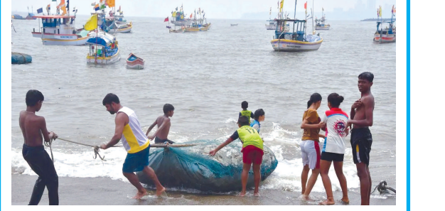
જામનગર, તા. ૧૬

તૌકતેને પગલે જામનગરનાં બંદર પર મરીન કમાન્ડો તૈનાત જામનગર સહિત સમગ્ર ગુજરાતનાં દરિયા કિનારે બીજા નંબરનું ભયસુચક સિગ્નલ લગાવી દેવાયા છે