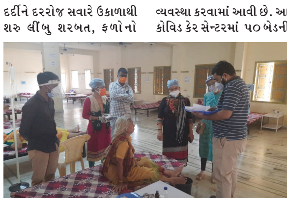
જયુસ, બે ટાઈમ નાસ્તો, બે ટાઈમ જમવાનું તેમજ તમામ દવાઓ વિના મૂલ્યે પુરી પાડવામાં આવે છે. આ ઉપરાંત આકસ્મિક જરૂર પડે તો ત્યાં ઓ કિસેજની પણ ટેમ્પરરી