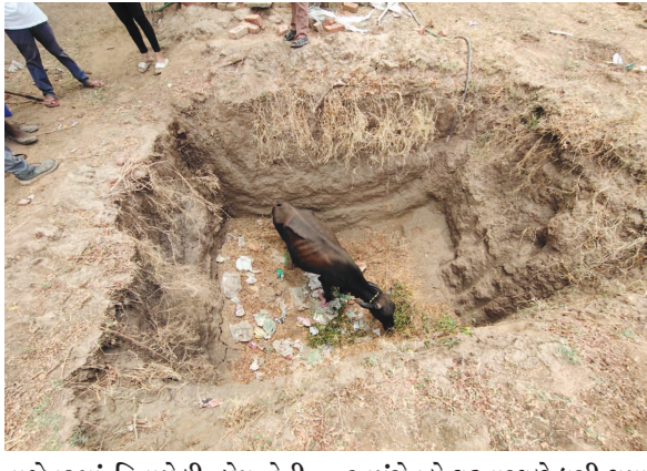
સ્વયંસેવકો ઘટનાસ્થળે ધસી ગયા હતા સ્થળ પર જોઈને જોયું તો ગાય દુઝણી હોવાથી તેને સલામત રીતે કેમ બહાર કાઢી શકાય તે અંગે વિચારણા કરવામાં આવી હતી. આ દરમિયાન ફાયર બ્રિગેડને પણ જાણ કરાઈ હોવાથી ફાયરની ટીમ આવી