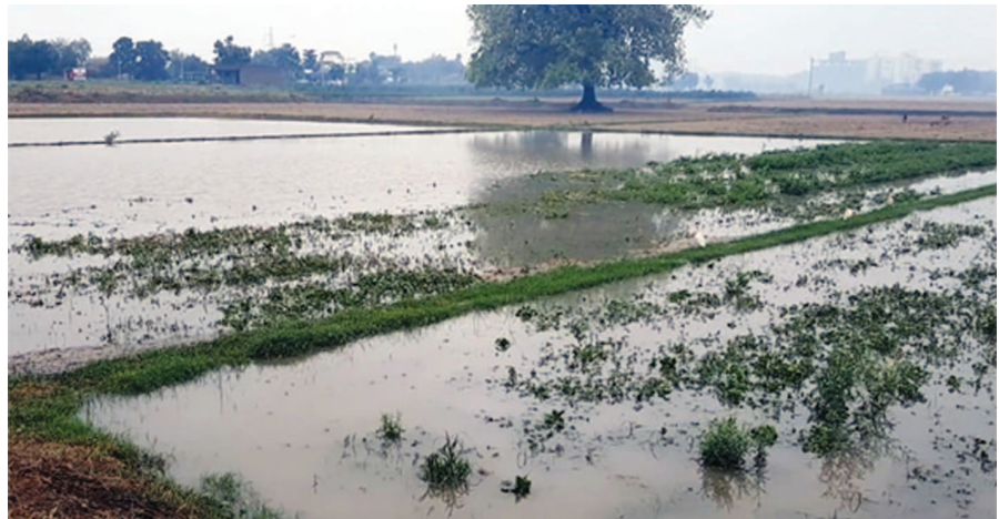
સાબરકાંઠા, અરવલ્લી જિલ્લો પણ પ્રમાણમાં ઓછી તબાહીથી પ્રભાવિત થયો છે. પ્રજાની મિલકતને અગણિત નુકસાન પહોંચ્યું છે. શુક્રવાર બપોરે સુધીમાં ૧૪ તાલુકામાં ૨૪૨ મકાનો તેમજ એક સરકારી શાળા અને પંચાયતને નુકસાન થયાના આંકડા સામે આચાર્ય છે. વાવાઝોડાના કારણે ૩૯ પશુઓનો મૃત્યુ આંક વધીને ૩૯ ઉપર પહોંચ્યો છે. દૂધાળા પશુના મૃત્યુ કેસમાં પશુ દીઠ રૂ. ૪૦૦ જાહેર તંત્ર સહાય ચૂકવવામાં આવશે.

બાયડ (બ્યુરો ઓફિસ) તા. ૨૧ વાવાઝોડા સમયે તંત્ર એલર્ટ વરસ્યો. ગણતરીના કલાકો માટે તાઉ-તે વાવાઝોડાના કારણે મોડ ઉપર હોવા છતાં શહેરી કરતાં નિયાજવાળા વિસ્તારો અને ખેતરો