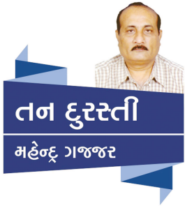
તળ દુસ્તરી મહેન્દ્ર ગજજર