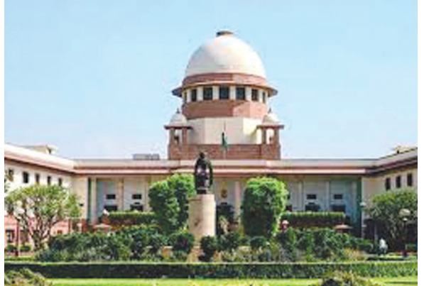
કોરોનાથી મરનારાના પરિવારને સહાયતા મુદ્દે સુનાવણી