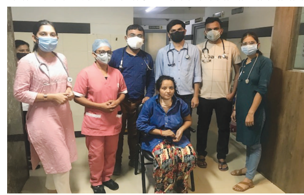
પરિસ્થિતિમાં કોરોના સામે જંગ લડી રહ્યા હતા. ઘાતક કોરોનાએ અનેક દર્દીઓનો ભોગ લીધો છે. બીજીતરફ હોસ્પિટલના બિંધાને મરણ પથારીએ કોરોના સામે જંગ લડતા દર્દીઓનો જીવ પણ બચાવી