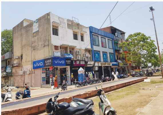
હજુ પણ કોરોનાના ઓછાયા સાથે ભેદક ફંગસના વધી રહેલા કેસની સંખ્યાનો ભય પણ માસમાં ગાંધીનગરમાં અત્યંત ચિંતાજનક અને ડરામણી સ્થિતિ સર્જાઈ હતી તેના પછી લાદવામાં

અત્યારે સંક્રમણ ઘટવા સાથે ઓકિસજન વગેરેની જરૂરિયાતવાળી જોખમી સ્થિતિમાં રાહત થતાં શહેરજનોના માથેથી ચિંતાનો બોજ ઘટતો જણાય છે. જો કે મ્યુકોરમાઈકોસિસના વધેલા કેસોથી નવી ફક્ક જરૂર પેસી છે પરંતુ એકંદરે અનેક નાગરિકોના કોરોનાટીન પીરીયડ પણ પુરા થયા છે અને મોટી સંખ્યામાં દર્દીઓ હોસ્પિટલમાંથી કોરોનામાંથી સાજા થઈને પરત ફરી રહ્યા છે જેના કારણે વિશ્વાસભર્યા વાતાવરણમાં વધારો થવા પામ્યો છે જેની સીધી અસર જનજીવન પર પડી છે અને પુનઃ ઉત્સાહનો ધીમો સંચાર થતો જણાઈ રહ્યો છે.