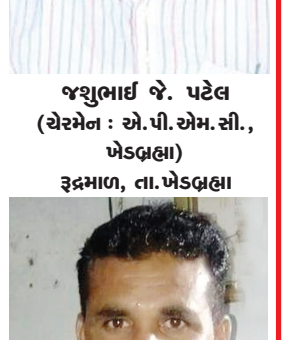
તલીફખાન બલોચ બાયડ, જિ. અરવલ્લી