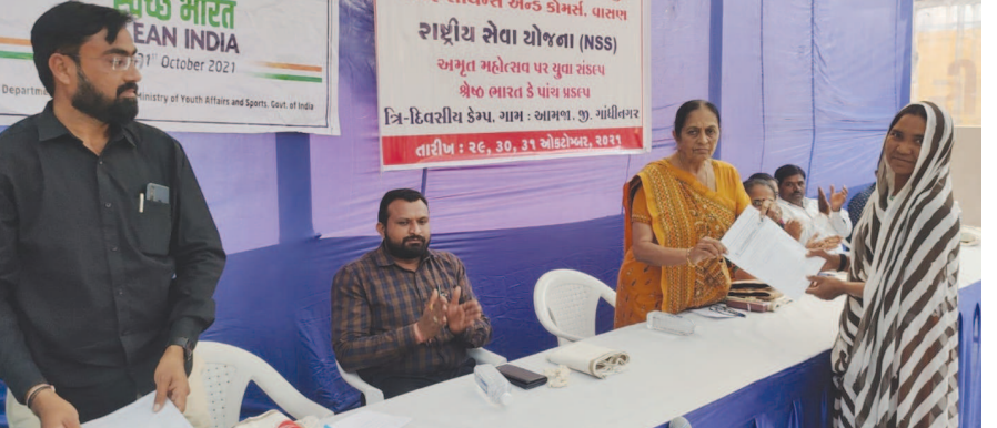
આમજા પ્રા.શાળામાં બાપુ કોલેજ દ્વારા એન.એસ.એસ. કેમ્પનું આયોજન કરવામાં આવ્યું છે. આ કેમ્પનું ઉદ્ઘાટન સાંસદ શારદાબેન પટેલે કર્યું હતું. આ ઉદ્ઘાટન સમારોહમાં ૧૦૦ થી વધુ વિદ્યાર્થી સહાયના હુકમોનું વિતરણ કરવામાં આવ્યું હતું.

સાથે લક્ષ્મીજીના રમા સ્વરૂપની પૂજા કરવામાં આવે છે. અનેક જગ્યાએ આજના દિવસે મહાપૂજા કરવામાં આવે છે. આ દિવસે લક્ષ્મીજી સાથે વિષ્ણુ ભગવાનની પૂજા કરવાથી ધન વર્ષ અને શુભ લાભની પ્રાપ્તિ થાય છે. ભગવાન વિષ્ણુ હંમેશા યોગ નિદ્રામાં શયન કરતા અને કારતક માસની આ એકાદશીએ ભગવાન જાગ્યા તેથી આ એકાદશી રમા એકાદશી તરીકે ઓળખાય છે. આજના દિવસે ઉપવાસ કરવાથી ચિંતામણી અને કામધેનુના સમાન ફળની પ્રાપ્તિ સાથે જીવનની સુખ સમૃદ્ધિમાં વધારો થાય છે. વાઘ બારસમાં સરસ્વતી ભગવાનની પૂજા કરવામાં આવે છે. આજે રાત્રિ દરમિયાન શહેરમાં જગમગાટ જોવા મળશે.