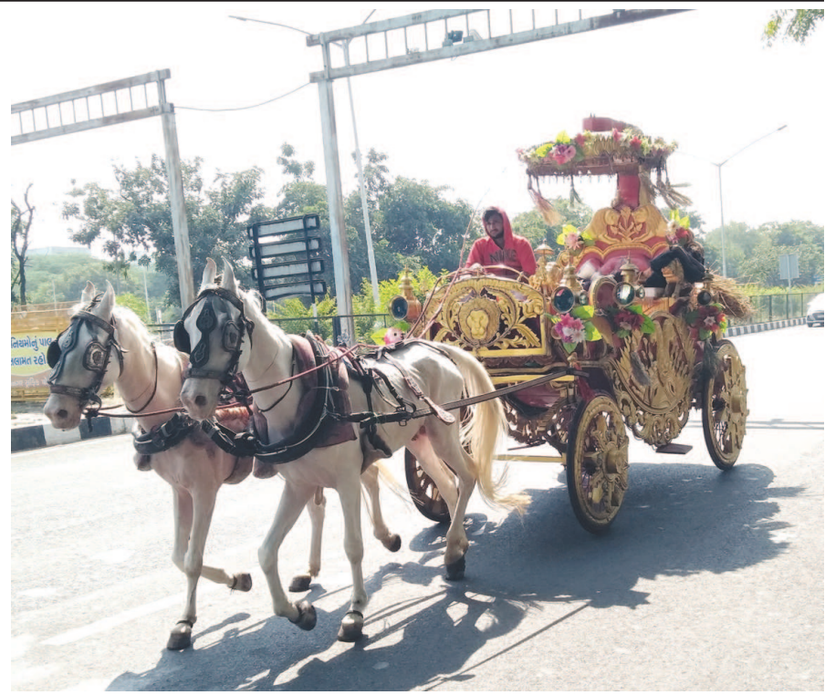
અત્યાધુનિક વાહનોની સામે ઘોડાગાડી-બળદગાડી જેવા પરિવહનના સાધનો સાવ આઉટડેટ થઈ ગયા છે. સરઘસ કે વરઘોડામાં ક્યારેક ઘોડાગાડીનો ઉપયોગ થાય છે. ટ્રાફિકથી ભરતરક રસ્તાઓ પરથી પસાર થતી ઘોડાગાડી સૌના આકર્ષણનું કેન્દ્ર બની છે.