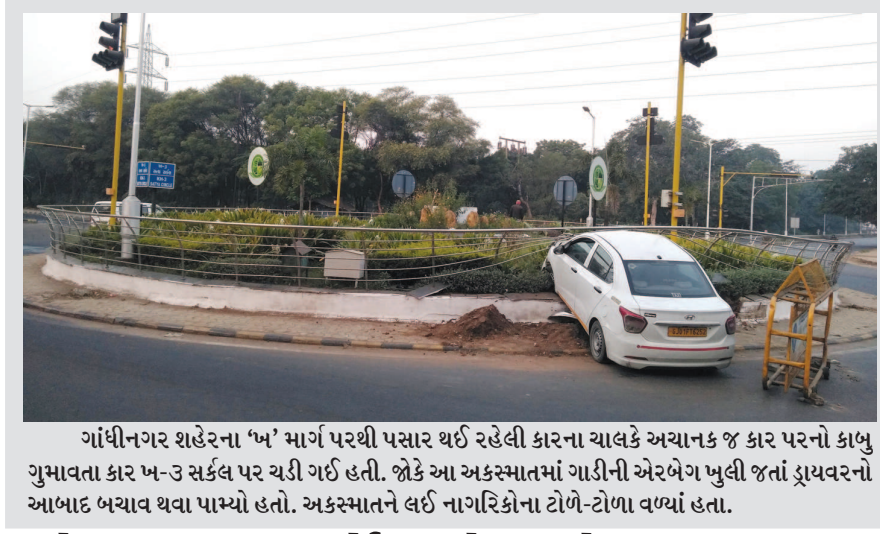
ગાંધીનગર શહેરના 'ખ' માર્ગ પરથી પસાર થઈ રહેલી કારના ચાલકે અચાનક જ કાર પરનો કાબુ ગુમાવતા કાર ખ-૩ સર્કલ પર ચડી ગઈ હતી. જોકે આ અકસ્માતમાં ગાડીની એરબેગ ખુલી જતાં ડ્રાઇવરનો આભાદ બચાવ થવા પામ્યો હતો. અકસ્માતને લઈ નાગરિકોના ટોળે-ટોળા વળ્યાં હતા.