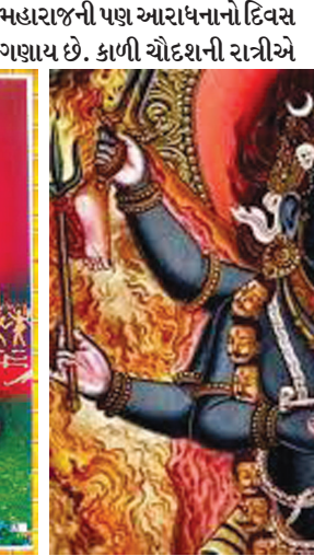
ભુવા-તાંત્રિકો વગેરે દ્વારા સ્મશાન અથવા અગોચર જગ્યાએ મંત્ર-તંત્ર અને મેલી વિદ્યા સાથે વિવિધ ગુપ્ત વિધીઓ કરવામાં આવતી હોય છે