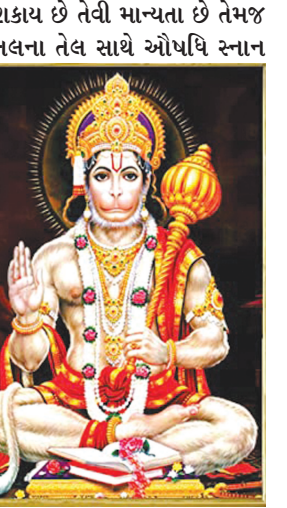
કરવાથી વ્યાધિથી મુક્તિ મળી દિર્ઘાયુ જીવન પ્રાપ્ત થતુ હોવાની પણ માન્યતા છે. અનેક શ્રદ્ધાળુઓ કાળી