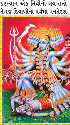
સાથે કાળી ચૌદશની તિથીનો સંગમ છે. દિવાલની સામે અપરમા પર્વ કાળ ભૈરવની પૂજા-અર્ચનાનો મહિમા છે તે સાથે સાથે હનુમાનજી

ગાંધીનગર, તા. ૨ આજે ધનતેરસના પાવન દિવસથી દિવાળીનો માહોલ છવાઈ ગયો છે. શહેરમાં આવતીકાલે બુધવારે કાળી ચૌદશનું પર્વ ઉજવાશે. આસો માસના વદપક્ષની ચૌદશની તિથી એટલે કાળી ચૌદશ જેને કેટલીક વ્યક્તિઓ નરક ચૌદશ તરીકે પણ ઓળખે છે. આ દિવસે યમરાજને દીપદાન આપવાનો અને હનુમાનજીને સિંદૂર, તેલ, કાળા તલ અને અડદનો અભિષેક કરવાનો મહિમા છે. આ ઉપરાંત કાળીચૌદશે ઔષધિવિદ્યાન કરવાથી વ્યાધિથી મુક્તિ મળે છે અને દિર્ઘાયુ જીવન બને છે તેવી માન્યતા છે. આ સાથે ધરમાંથી કકળાટ કાઢવાની માન્યતા પણ પ્રવર્તે છે. આ વર્ષે નવરાત્રીના પર્વ