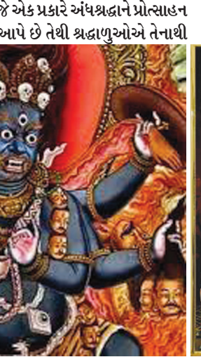
બચવું જોઈએ. કાળી ચૌદશે યમરાજને પ્રસન્ન કરવા સુધાર્ણા પદ્મી દક્ષિણ દિશામાં દીપદાન કરવાથી અકાળ મૃત્યુ ટાળી