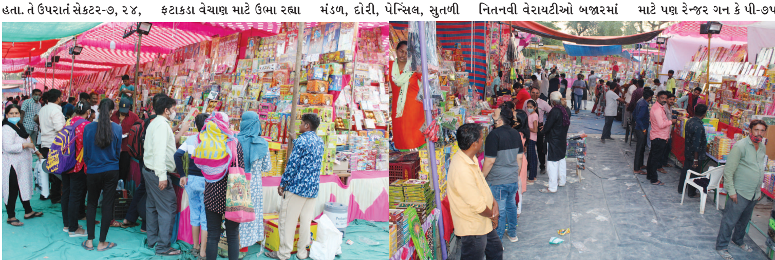
ઉપલબ્ધ હતી. જ્યારે બજારમાં નામની બંદુક બજારમાં નવી આવી હતી. શહેરના બજારોમાં આખરી