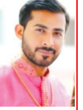
પૂર્વ સૌધરી દુભઈ (વસાદરા)