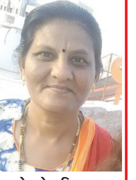
નેહાબેન વિ. શાહ સ્વામિનારાયણ સોસાયટી વિભાગ ૨ બાયડ