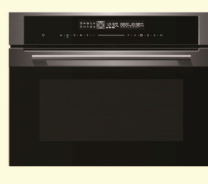
BUILT IN OVENS