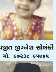
આરવ જતીન વ્યાસ