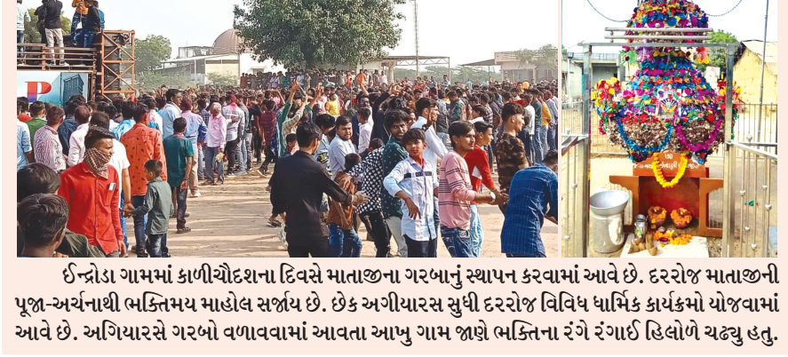
ઈન્દ્રોડા ગામમાં કાળીચૌદાશ દિવસે માતાજીના ગરબાનું સ્થાપન કરવામાં આવે છે. દરરોજ માતાજીની પૂજા-અર્ચનાથી ભક્તિમય માહોલ સર્જાય છે. છેક અગીયારસ સુધી દરરોજ વિવિધ ધાર્મિક કાર્યક્રમો યોજવામાં આવે છે. અગિયારસે ગરબો વળાવવામાં આવતા આખું ગામ જાણે ભક્તિના રંગે રંગાઈ હિલોળો ચઢ્યું હતું.