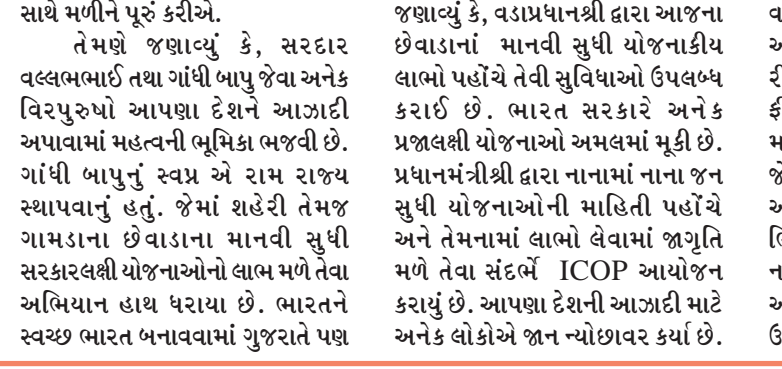
જણાવ્યું કે, વડાપ્રધાનશ્રી દ્વારા આજના છેવાડાનાં માનવી સુધી યોજનાકીય લાભો પહોંચે તેવી સુવિધાઓ ઉપલબ્ધ કરાઈ છે. ભારત સરકારે અનેક પ્રજાલક્ષી યોજનાઓ અમલમાં મૂકી છે. પ્રધાનમંત્રીશ્રી દ્વારા નાનામાં નાના જન સુધી યોજનાઓની માહિતી પહોંચે અને તેમનામાં લાભો લેવામાં જાગૃતિ મળે તેવા સંદર્ભે ICOP આયોજન કરાયું છે. આપણા દેશની આઝાદી માટે અનેક લોકોએ જાન ન્યોછાવર કર્યા છે.