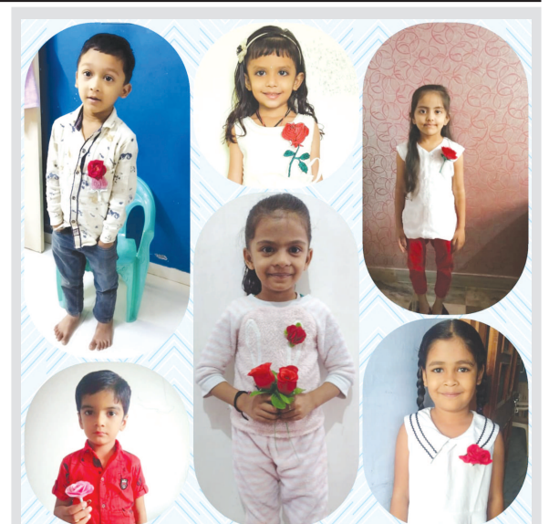
ઈન્ટરનેશનલ પબ્લિક સ્કૂલમાં બાલદિનની ઉજવણી ગાંધીનગર ઈન્ટરનેશનલ પબ્લિક સ્કૂલમાં પ્રિ.પ્રાઈમરી વિભાગમાં બાલદિનની ઉજવણી કરવામાં આવી હતી. જેમાં બાળકોને ચાચા નહેરુ વિષે જાણકારી આપવામાં આવી હતી અને બાળકોએ કાગળમાંથી કમળ બનાવ્યું હતું. બાલદિન નિમિત્તે બાળકોએ શિક્ષકોના સાથ સહકારથી ઉત્સાહપૂર્વક ઉજવણી કરી હતી.