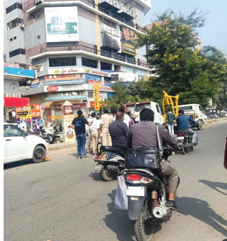
૬૦ કિમીની સ્પીડથી વધારે સ્પીડમાં વાહન ચલાવશે તો તે

પોલીસતંત્ર દ્વારા ટ્રાફિક નિયમોને કડક કરવા માટેની કાર્યવાહી માટે લાલ આંખ કરવામાં આવી છે. શહેરના તમામ માર્ગો પરના સીસીટીવી