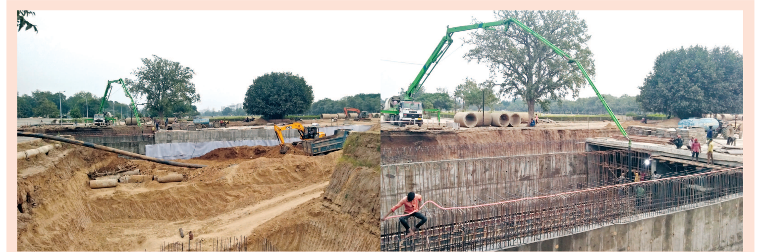
તડામાર તૈયારીઓ - વાયબ્રન્ટ સમિટીના પગલે શહેરના બીજા અન્ડરપાસ એટલે ગ-૪ના અન્ડરપાસની કામગીરી પૂરજોશમાં ચાલી રહી છે... રાત-દિવસ ચાલતી કામગીરી ડિસેમ્બર સુધીમાં સંપૂર્ણ થાય એવો ટાઈમ નિયત કરાયો છે... શહેરના બંને મુખ્યમાર્ગો પરના અન્ડરપાસ થતાં ટ્રાફિકનો પ્રશ્ન હળવો થશે એમ મનાય છે... જ્યારે ય-માર્ગ પર 'ચ-૨' અને 'ચ-૩'ના અન્ડર પાસને પણ મંજૂરી અપાઈ ગઈ છે પરંતુ વાયબ્રન્ટ સમિટી બાદ કામગીરી શરૂ કરાશે એવી ચર્ચાઓ છે...

આપવામાં આવી હતી. ડીસ્ટ્રીક્ટ શોપીંગ સહિતના વિસ્તારમાં ઝડપથી કામગીરી પૂર્ણ થાય તે જોવા જણાવ્યું હતું. આ વિસ્તારમાં ગટર ઉભરાવવાની, સ્વચ્છતા સહિતના મુદ્દાઓ પર પણ ધ્યાન કેન્દ્રીત કરવા જણાવવામાં આવ્યું હતું. મળતી વિગતો પ્રમાણે સ્માર્ટ સીટી પ્રોજેક્ટમાં ફરજો બજાવતા કમચારીઓની વિગતો તેમના એજ્યુકેશનલ ક્વોલીફિકેશન તેમજ અનુભવ અને ભરતી પ્રક્રિયા સહિતની વિગતો પદાધિકારીઓને આપવાની સૂચના પણ આપવામાં આવી છે.