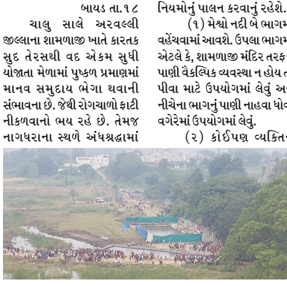
પ્રેરિત અને પ્રણાલિકાગત સ્ત્રીઓને તેમની મરજી વિરુદ્ધ બે થી ત્રણ કલાક સુધી ઠંડા પાણીમાં સ્નાન વિધિ કરવામાં આવે છે. આ પ્રકારની પ્રવૃત્તિઓને જે તેમના આરોગ્ય માટે હાનિકારક છે, તે જાહેર હિતમાં અટકાવવા સાવચેતીના પગલા ભરવા જરૂરી છે. તેમજ સ્વચ્છ પાણી અને ખોરાકની સગવડ માટે અને ચેપી રોગચાળા વાળા માણસોથી બચવા તથા રોગ ન થવા દેવા અથવા તેનો ફેલાવો અટકાવવાના પાગલ લેવા જરૂરી છે.

જાહેર હિતમાં સાવચેતી રાખવા,સ્વચ્છ પાણી અને ખોરાકની સગવડ માટે તથા ચેપી રોગવાળા માણસોથી બચવા જાહેર કરેલ નિયમોનું પાલન કરવાનું રહેશે : મેળામાં આવનાર દરેક વ્યક્તિઓને મેળો પૂર્ણ થાય ત્યાં સુધી ૧૭ ડિસેમ્બરથી ૧૯ ડિસેમ્બર સુધી જાહેરનામાનો અમલ કરાશે