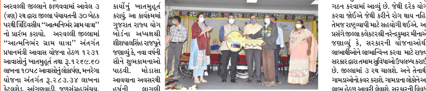
પહેરે અને તેનો લાભ દરેક પ્રજાને લેવો જોઈએ. જિલ્લામાં ૨ થી દારા ૯૯૩ જેટલા રૂંટો પર ૧૦૬૦૫ જેટલા ગામોને લાભ અપાશે. ગામડાના ઇલાજાના માનવી સુધી આ યોજનાઓનો લાભ પહોંચે તેના કાર્યકર્મીઓએ કહ્યું છે. દરેક રથમાં એલઈડી સ્ક્રીન સાઈન સિસ્ટમ માર્ગક વગેરે ઉપલબ્ધ રહેશે જેના દ્વારા વિવિધ યોજનાકીય બાબતો અંગે ગ્રામજનોને રોગ તથા નથી. તેમણે બાગાયત ખેતીને અપનાવી વધુમાં વધુ કુશળોપણ કરવા અપીલ કરી હતી. આત્મનિર્ભર ગ્રામયાત્રા અંતર્ગત નિવિધિસીય કાર્યક્રમો જોરે જોરે લાભ સર્વ જનતાને મળશે. ૯૦૦ જેટલા રસીકરણ કેમ્પ, ૮૪ જેટલા વર્કશોપ, ૧૦૦૦ જેટલી સ્વપાંચોનું આયોજન કરવામાં આવ્યું છે. જન-જન સુધી આ સુવિધાઓ પહોંચે અને ગામડાઓનો વિકાસ થાય માટે આ અભિયાન શરૂ કરાયું છે. તેમજ સરકાર દ્વારા યોગ બોર્ડનું ગઠન કરવામાં આવ્યું છે. જેથી દરેક યોગ કરવા જોઈએ જેથી કરીને રોગ થાય નહિ. તેમજ રાષ્ટ્રવાપી માટે સહયોગી થઈએ. આ પ્રસંગે જિલ્લા કલેક્ટરશ્રી નરેન્દ્રકુમાર મીનાએ જણાવ્યું કે, સરકારની યોજનાઓથી લાભાર્થીઓને લાભાન્વિત કરવા માટે રાજ્ય સરકાર દ્વારા તમામ સુવિધાઓ ઉપલબ્ધ કરાઈ છે. જિલ્લામાં ૨ થી ચાલશે. અને તેનાથી ગામડાઓનો કવર કરાશે. ગામડાના લોકોને આ લાભ હેઠળ આવરી લેવાશે. સરકારની વિવિધ યોજનાઓનો લાભ આવા માટે ખુબ સસર આયોજન કરાયું છે. આ પ્રસંગે જિલ્લા પંચાયત પ્રમુખ ભિપીનભાઈ, જિલ્લા ગ્રામ વિકાસ અધિકારીશ્રી શ્રેયા તેવટીયા, તાલુકા પંચાયત પ્રમુખ ભિપીનભાઈ, જિલ્લા ગ્રામ વિકાસ અધિકારીશ્રી દાવેરા, જિલ્લા પુરવઠા અધિકારીશ્રી ડોડીયા, નાયબ જિલ્લા વિકાસ અધિકારીશ્રી, મોડાસા મામલતદારશ્રી અરુણ ગઢવી, NIA અધિકારીશ્રી, જિલ્લાના અન્ય અધિકારીશ્રીઓ તથા બહોળી સંખ્યામાં લાભાર્થીઓ ઉપસ્થિત રહ્યા હતા.

લાભાર્થીઓને રૂ. ૨.૭૮ લાખની સહાય, જળ સંપતિ વિભાગ હેઠળ રૂ. ૩૭૧.૯૪ લાખના ૩ વિવિધ વિકાસલક્ષી કાર્યોનું ખાતમુહૂર્ત, પંચાયત વિભાગ દ્વારા ૧૫માં નાણાપંચ અંતર્ગત રૂ. ૪૦૧.૫૫ લાખના ૧૫૮ વિવિધ વિકાસલક્ષી કાર્યોનું ખાતમુહૂર્ત તથા રૂ. ૨૯૩.૩૧ લાખના ૧૧૩ વિવિધ વિકાસલક્ષી કાર્યોનું લોકાર્પણ તેમજ પાણી પુરવઠા વિભાગ અંતર્ગત રૂ. ૪૧૧.૪૧ લાખના ૨૨ વિવિધ વિકાસલક્ષી કાર્યોનું ખાતમુહૂર્ત કરાયું. આ કાર્યક્રમમાં ગુજરાત રાજ્ય યોગ બોર્ડના અધ્યક્ષશ્રી શ્રીશંકરસિંહ રાજપૂતે જણાવ્યું કે, નવ વર્ષની સૌને શુભકામનાઓ પાઠવી. મોડાસા આવવાના અવસરથી હર્ષની લાગણી અનુભવું છું. દરેક વ્યક્તિ નિરોગી અને તેવી પરમાત્માને પ્રાર્થના. આઝાદીના ૭૫ વર્ષ પૂર્ણ થવા નિમિત્તે ભારત સરકાર દ્વારા ૭૫ અઠવાડિયા આઝાદી ક્રા અમૂત મહોત્સવની ઉજવણી કરવાનું નક્કી કરાયું છે. જેને લઈને મુખ્યમંત્રીશ્રી ભુપેન્દ્રભાઈ પટેલ દ્વારા દેશના વડાપ્રધાનશ્રી નરેન્દ્રભાઈ મોદીના આત્મનિર્ભર ભારતના સ્વપ્નને લઈને તેમણે સાકાર કરવા માટે 'આત્મનિર્ભર ગ્રામયાત્રા'નું અભિયાન હાથ ધર્યું છે. તેમણે જણાવ્યું કે, સરકારની વિવિધલક્ષી યોજનાઓનો લાભ ઇલાજાના માનવી સુધી