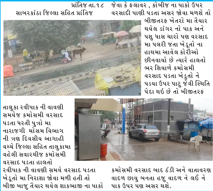
પ્રાંતિજ તા.૧૮ જેવા કે ફલાવર, કોબીજ ના પાકો ઉપર સાબરકાંઠા જિલ્લા સહિત પ્રાંતિજ વરસાદી પાણી પડતા અસર જોવા મળશે તો બીજીતરફ ખેતરો મા તૈયાર થયેલ ડાંગર નો પાક અને પશુ ધાસ ચારો પણ વરસાદ મા પલરી જતા ખેડૂતો ના હાથમા આવેલ કોરીઓ છીનવાયો છે ત્યારે હાલતો ભર શિયાળે કમોસમી વરસાદ પડતા ખેડૂતો ને પડ્યા ઉપર પાટું જેવી સ્થિતિ પેદા થઈ છે તો બીજીતરફ તાલુકા રવીપાક ની વાવણી સમયેજ કમોસમી વરસાદ પડતા ધરતી પુત્રો મા નારાજગી મોસમ વિભાગ ની ત્રણ દિવસીય આગાહી વચ્ચે જિલ્લા સહિત તાલુકામાં વહેલી સવારથીજ કમોસમી વરસાદ પડતા હાલતો રવીપાક ની વાવણી સમયે વરસાદ પડતા ધરતી પુત્રો મા નિરાશા જોવા મળી હતી તો કમોસમી વરસાદ બાદ ઠંડી અને વાતાવરણ વાદળ ધાણ બનતા હજુ વાદળ ને લઈ ને પાક ઉપર પણ અસર થશે.

કમોસમી વરસાદ પડતા શાકભાજી સહિત ખેતીમાં નુકસાન : કમોસમી વરસાદ પડતા ધરતી પુત્રોમાં નારાજગી : રવિ સિમ્બલી વાવણી સમયે જ કમોસમી વરસાદ : કમોસમી વરસાદ પાડવાથી ખેતીમાં પડતા ઉપર પાટું જેવી સ્થિતિ પેદા થયું : કમોસમી વરસાદ બાદ વાદળધાણ વાતાવરણ સાથે ઠંડો પવન છૂટ્યો