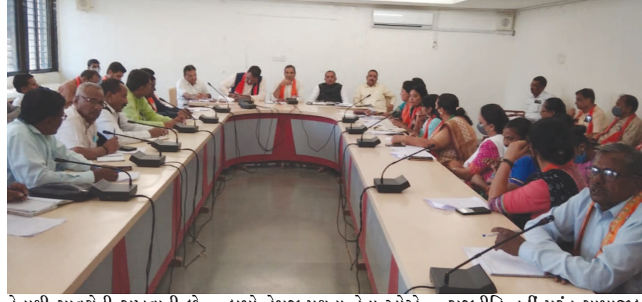
તેનાથી સાવચેતી રાખવાની છે અને સમાજમાં આપણી વિચારસરણી આપણા કેટલાક

બાયડ તા.૨૩ ભારતીય જનતા પક્ષ સાબરકાંઠા જિલ્લા દ્વારા આજરોજ જિલ્લાના હોદ્દાદારોની બેઠક હિંમતનગર મુકામે યોજવામાં આવેલ જેમાં જિલ્લા ભાજપ પ્રમુખ જે.ડી. પટેલે જણાવેલ કે, મંડલનું પ્રશિક્ષણ વર્ગોનું આયોજન કરવામાં આવેલ છે જે પંદર દિવસમાં પૂર્ણ કરવું અને તેના અધ્યક્ષ તરીકે ધારાસભ્ય રહેશે, જો પેજ કમિટીનું કામ બાકી હશે એ પણ પૂર્ણ કરી દેવાનું છે પ્રદેશ ભાજપ પ્રમુખ સી.આર.પાટીલ સાહેબ આગામી ડિસેમ્બર મહિનામાં આપણા ત્યાં વનરો નો કાર્યક્રમ છે જેમાં તમામ