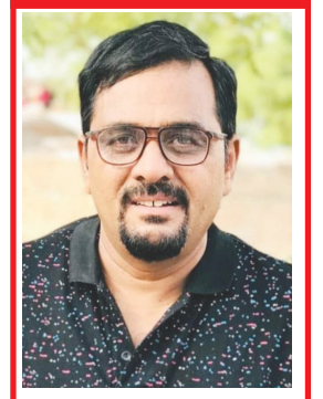
દાનશ્યામભાઈ એસ.પટેલ સ્વામિનારાયણ સોસાયટી વિભાગ-૧ બાયડ, જુલો અરવલ્લી