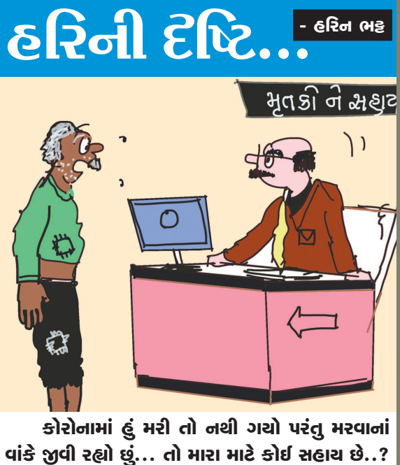
કોરોનામાં હું મરી તો નથી ગયો પરંતુ મરવાનાં વાંકે જીવી રહ્યો છું... તો મારા માટે કોઈ સહાય છે..?