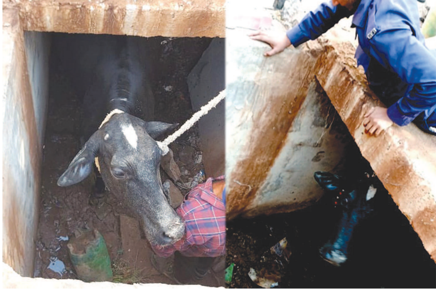
સેક્ટર-૧૫ કોલેજની પાછળના વિસ્તારમાં એક ગાય પાડામાં પડી ગઈ હતી. ફાયરબ્રિગેડના જવાનોએ તેને ભારે જહેમત બાદ ઉગારી હતી.

ગાંધીનગર, તા. ૨૭ ચંદ્રલાના કોર્ટ પર વાહન ચેકીંગ દરમિયાન ઈલેક્ટ્રીક સામાનની આડમાં કન્ટેનરમાં બે પાસંલમાંથી ૪૨ બોટલ દારૂની મળી આવી છે. પોલીસે રૂ. ૪૭,૪૮૦ નો મુદ્દામાલ કબ્જે કરી આગળની તપાસ હાથ ધરી છે. ચિલોડા-હિંમતનગર હાઈવે માર્ગ પર ચંદ્રલા નાકા પોર્ટ પર વાહન ચેકીંગની કામગીરી ચાલી રહી હતી. તે દરમિયાન હિંમતનગર તરફથી આવી રહેલા બંધ બોડીના ટાટા કંપનીના કન્ટેનર નં. એચ. આર. ૫૫. ૩૭૯૫. - ૪૮૨૬ ને ઊભું રખાવ્યું હતું. ત્યારબાદ ડ્રાઈવરને નીચે ઉતારી કન્ટેનર ચેક કરતા તેમાં નાના મોટા અલગ પાસંલ ભરેલા હતા. આ ઈલેક્ટ્રીક પાસંલમાં બે પાસંલ શંકાસ્પદ લાગ્યા હતા. આ પાસંલોને નીચે ઉતારી ચેક કરતા તેમાંથી વિદેશી દારૂની ૪૨ બોટલ મળી આવી હતી. ડ્રાઈવરને પાસંલ અંગે પુછપરછ કરતા જ્યુર ગોલ્ડન ટ્રાન્સપોર્ટની જયપુર ઓફિસ ખાતેથી મહાલક્ષ્મી ઈલેક્ટ્રીકલના યોજાએ આ પાસંલ નડીયાદ ડુમરાલ બજાર કિષ્કા માર્કેટિંગવાળાએ મંગાવ્યું હોવાની હકીકત જાણવા મળી હતી. પોલીસે પ્રોહી એક્ટ મુજબ ગુનો નોંધી આગળની તપાસ હાથ ધરી છે.