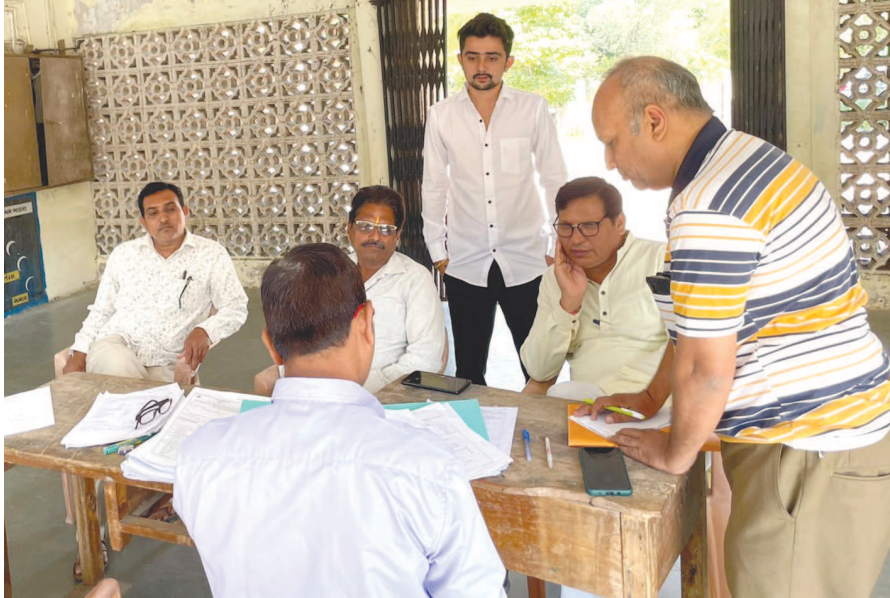
સમસ્યા, અજાણ્યા ફેરિયાદોની અવરજવર, વૃક્ષોનું નિયમિત મળતી વિગતો પ્રમાણે નગરસેવકોએ સેનેટરી જાહેરમાં મુકાયેલા ડસ્ટબીનો નિયમિત રીતે ઉપડી જાય તે જોવા

ગાંધીનગર, તા. ૨૭ ગાંધીનગર શહેરમાં સ્વચ્છતાના મુદ્દે કાઉન્સિલરોને ફરિયાદ મળતાં હસ્તકમાં આવેલા કાઉન્સિલરોએ હવે કામગીરી સંભાળતા સેનેટરી ઈન્સ્પેક્ટરને બોલાવી અને આ અંગે ફરિયાદોના નિકાલનું અભિયાન ઇચ્છુ છે. ગાંધીનગર વોર્ડ નં. ૧૦ માં આવતા સે. ૧ અને સે. ૮ માં આજે લોકસંપર્ક અભિયાનમાં નીકળેલા નગરસેવકોને ૧૦ જેટલી ફરિયાદો મળી હતી. આ નગરસેવકોને ગાર્ડનની જાળવણી, કોમન પ્લોટની સફાઈ, અધૂરા સાઈન બોર્ડ, પાણીના નુકેલા જોડાણો, રખડતા પશુઓની ડીમીંગ નહિ થતું હોવાનું ફરિયાદ તેમજ સ્ટ્રીટલાઈટો બંધ રહેતી હોવાની ફરિયાદો હતી. ઈન્સ્પેક્ટરને બોલાવી સફાઈની કામગીરી સઘન રીતે થાય તે જોવા આગ્રહ કર્યો હતો. આ ઉપરાંત પણ જણાવ્યું હતું. જ્યારે અન્ય ફરિયાદો અંગે સોમવારે મનપાની કચેરી ખુલતાં તેના નિકાલ માટેના પ્રયાસો હાથ ધરશે તેવી હેાવાધારણ આપી હતી.