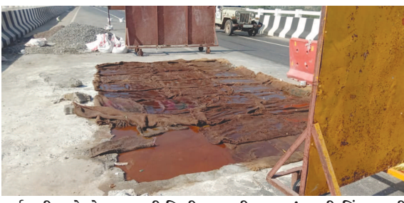
કર્મચારી અને કોન્ટ્રાક્ટરની મિલીબગતથી કામ માં મોટો ભ્રષ્ટાચાર જોવા મળી રહ્યો છે.

ધાનેરા તા. ૨૭ ઇપાવવાની કોશિશ કરી રહ્યા છે? પરંતુ સ્થળની મુલાકાત લેતા દેખાઈ આવે છે કે આ રીપેરીંગ કામ વધારે સમય ટકી રહે તેમ લાગતું નથી અને ઓચિંતું આ રોડનું પોપડો નીચે પડશે ત્યારે મોટાં અકસ્માત સર્જાશે તેવી સંભાવના જોવા મળી રહી છે આ પુલ બનાવ્યાં ને એક વર્ષ પછી થયું નથી અને પુલ પર મોટા ગાબડાં પડી રહ્યાં છે તે નાની વાત નથી પરંતુ કોન્ટ્રાક્ટર અને અધિકારીઓ ને દેશ ના વિકાસ ની ચિંતા નથી ફક્ત પોતાનો વિકાસ માં રસ છે