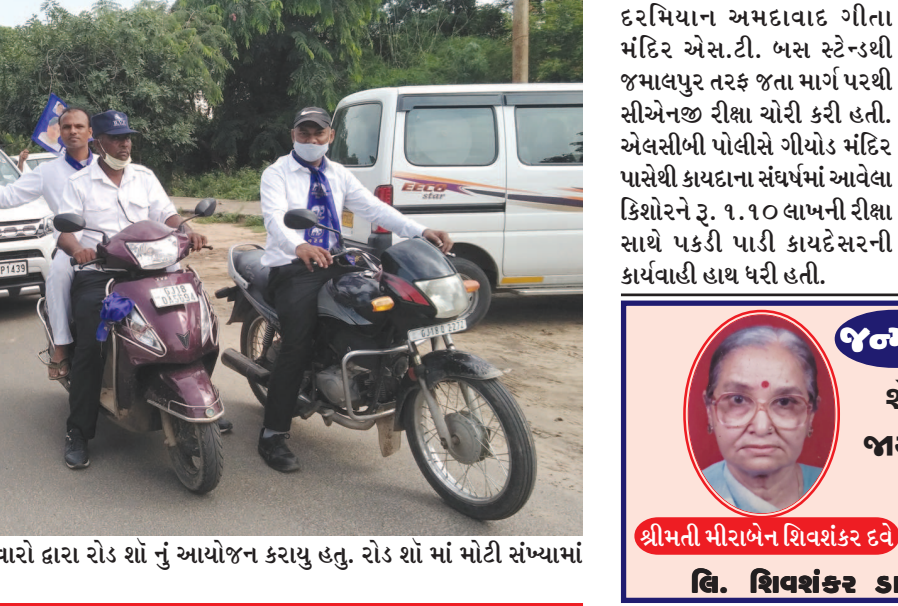
બહુજન સમાજ પાર્ટીના ઉમેદવારો દ્વારા રોડ શો નું આયોજન કરાયું હતું. રોડ શો માં મોટી સંખ્યામાં ઉમેદવારોના સમર્થકો જોડાયા હતા.

ગાંધીનગર, તા. ૩૦ મહિલા શિક્ષિકાને કરોલીની એન.એમ. પટેલ સરસ્વતી વિદ્યાલયના ઈન્ચાર્જ આચાર્ય તેમજ શાળા સંચાલક મંડળ દ્વારા વારંવાર ધમકી આપે છે. ખોટા આરોપો કરવામાં આવે છે તેમજ મેમો આપવામાં આવે છે. ઉપરાંત ખોટા આક્ષેપ કરીને મારૂ નામ બદનામ થાય તેવું વર્તન કરવામાં આવતું હોવાના આક્ષેપ સાથે મહિલા શિક્ષણ સહાયક કે મહિલા આયોગ તેમજ શિક્ષણ કમિશનરને લેખિત રજૂઆત કરી છે. કરોલી ગામની એન.એમ. પટેલ સરસ્વતી વિદ્યાલયના ઈન્ચાર્જ આચાર્ય અને શાળાના મંડળ દ્વારા માનસિક ત્રાસ આપતા હોવાના આક્ષેપ સાથે શિક્ષણ સહાયક મહિલા કર્મચારીએ મહિલા આયોગમાં રજૂઆત કરી હતી. મહિલા શિક્ષિકાને વિદ્યાર્થીઓને શિક્ષણ આપીને શિક્ષણ બોર્ડના પરિણામ પણ સારૂ આવે છે. મંડળની મોટીગમાં મંડળના મંત્રી દ્વારા બેન તેમ કામ કરતા નથી, વર્તન સારૂ નથી તેમજ તમને આપેલા મેમો બુકમાં છપાવીશુ અને મોટું બેનર લગાવીશુ કે શાળાના ઈતિહાસમાં આ બેન જોટલા મેમો કોઈને મળેલા નથી. વધુમાં રોહિતભાઈ કહે ત્યાં આંખો બંધ કરીને સહી કરી દેવાની નહી કરો તો ગમે તેમ કરીને તમને ફસાવીશુ. તમને પાંચ વર્ષ પૂરા કરવા નહી દઈએ. વિદ્યાર્થીઓ અને વાલીઓને શિક્ષિકા વિરૂદ્ધ ઉચ્કેરીને શિક્ષિકા સારૂ ભણાવતા નથી તેવી ફરીયાદ કરાવવી સહિતના મુદ્દે માનસિક ત્રાસ આપતા હોવાનો શિક્ષણ સહાયક મહિલા શિક્ષિકાએ આક્ષેપ કર્યો છે. શિક્ષિકાને સમગ્ર શિક્ષણ ગુજરાત દ્વારા વરચું અલ શાળાના આનંદના લાઈવ ક્લાસ માટે ઓફર કરવામાં આવ્યો હતો. તેમ છતાં શિક્ષિકાને મેમો પણ આપવામાં આવ્યો હતો જેથી આ બાબતે ફરિયાદ થઈ છે.