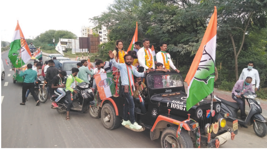
વોર્ડ નં. ૮ ના કોંગ્રેસના ઉમેદવાર દ્વારા રોડ શો નું આયોજન કરી જોરશોરથી પ્રચાર કરવામાં આવ્યો હતો. મતદારોએ તેમને ખૂબ સારો પ્રતિસાદ પૂરો પાડ્યો છે.