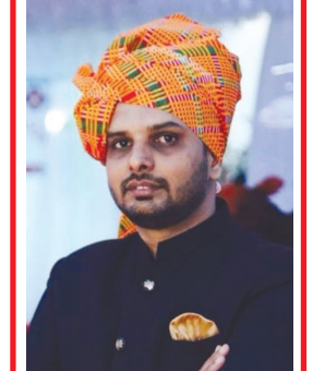
વિશાલ હિલીપભાઈ પટેલ આદિત્ય કોમ્પ્યુટર, બાયડ બાયડ