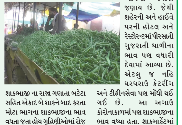
શાકભાજી ના રાજા ગણાતા બટેટા સહિત એકાદ બે શાકને બાદ કરતા મોટા ભાગના શાકભાજીના ભાવ વધતા જતા હોય ગૃહિણીઓમાં રોજ