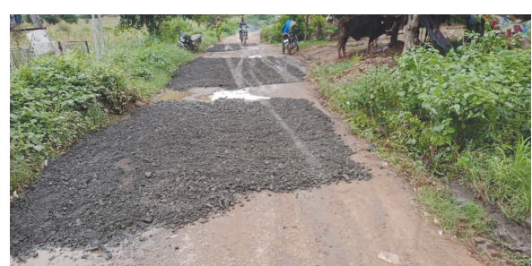
મેઘરજ તા. ૩ રાજ્ય સરકાર દ્વારા તા. ૧૦ મી ઓક્ટોબર, ૨૦૨૧