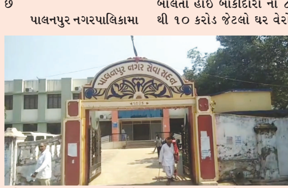
શહેરમા ૬૦૦ થી વધુ મકાનોનો ધર વેરો કેટલાય વર્ષો થી બાકી પાલિકાના ચોપડે ચડી જતા આખરે પાલીકા દ્વારા આ કરોડો

પાલનપુર, તા. ૩ પાલનપુર શહેરના કેટલાક લોકો નગરપાલિકા નો ધર વેરો ભરવામા લાપરવાહી દાખવતા હોઈ પાલિકાના ચોપડે ૮ થી ૧૦ કરોડનો ધર વેરો બાકી નીકળતો હોઈ પાલીકા દ્વારા આ બાકી કર વસૂલવા માટે બાકીદારો ને નોટિસો ફટકારવામા આવી છે જેમાં બાકીદારો તાકીદે બાકી વેરાની ભરપાઈ નહિ કરે તો તેમના મકાનોના નળ કનેક્શન કાપવા સહિત મકાનો સિલ કરવાનો તખ્તો ઘડવામાં આવ્યો છે