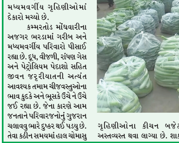
ગૃહિણીઓના કીચન બજેટ અસ્તવ્યસ્ત થવા લાગ્યા છે. શાક

બકાલાના ભાવમાં ઉછાળો આવતા ચિંતામગ્ન બનેલી ગૃહિણીઓમાં રોજીંદો કકળાટ વધી રહ્યો છે. શોળી, રીંગણા, ગુવાર, સરગવો, ટમેટા, દૂધી, કોબીઝ, ફલાવર, ભીંડો સહિતના શાકભાજીના ભાવમાં વધારો જણાય છે. જેથી શહેરની અને હાઈવે પરની હોટલ અને રેસ્ટોરન્ટમાં પીરસાતી ગુજરાતી થાળીના ભાવ પણ વધારી દેવામાં આવ્યા છે. એટલુ જ નહિ ઘરઘરાઈ કેટરીંગ અને ટીફીનસેવા પણ મોંઘી થઈ ગઈ છે. આ અગાઉ કોરોનાકાળમાં પણ શાકભાજીના ભાવ વધ્યા હતા. શાકમાર્કેટમાં અને શાકભાજી વેંચતા ડેરિયાઓ પાસે શાકભાજીના ભાવ સાંભળીને ગૃહિણીઓ શાક ખરીદવાનું અથવા જરૂરીયાત કરતા ઓછુ ખરીદીને સંતોષ માની રહ્યા છે. જ્યારે ઘણી ગૃહિણીઓ કઠોળ તરફ પણ વળી રહી છે. કેટલાક શાકભાજીના વિકેતાઓ દ્વારા મનસ્વી રીતે શાકભાજીના ભાવ ભાવ વસુલાઈ રહ્યા હોય અધુરામાં પુરુ ઉંચા દામ લઈને શાકની કવાન્ટીટી પણ ઓછી આપવામાં આવતી હોવાની હોય ગૃહિણીઓમાં કચવાટ વ્યાપી જવા પામેલ છે.