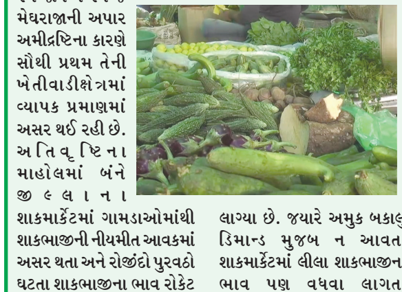
લાગ્યા છે. જ્યારે અમુક બકાલુ ડિમાન્ડ સુજબ ન આવતા શાકમાર્કેટમાં લીલા શાકભાજીના ભાવ પણ વધવા લાગતા

મોડાસા, ૦૩ રાજ્યમાં છેલ્લા સપ્તાહથી રાજ્યમાં છેલ્લા સપ્તાહથી સતત અને અવિરતપણે ૨૧ જિ ૨૧ જ મેઘરાજીની અપાર અમીત્રણિના કારણે સૌથી પ્રથમ તેની ખેતીવાડીકે જમાં વ્યાપક પ્રમાણમાં અસર થઈ રહી છે. અ તિ વ્ િ ના માહોલમાં બંને જી લ લ ના શાકમાર્કેટમાં ગામડાઓમાંથી શાકભાજીની નીચમીત આવકમાં અસર થતા અને રોજીંદો પુરવઠો ઘટતા શાકભાજીના ભાવ રોકેટ ગતિએ સડસડાટ રીતે આસમાને આંબી જતા ગરીબ અને મધ્યમવર્ગીય ગૃહિણીઓમાં ટેકારો મચ્યો છે. કમ્મરતોડ મોંઘવારીના અજગર ભરડામાં ગરીબ અને મધ્યમવર્ગીય પરિવારો પીસાઈ રહ્યા છે. દૂધ, વીજળી, રાંધણ ગેસ અને પેટ્રોલિયમ પેદાશો સહિત જીવન જરૂરીયાતની અન્યંત આવશ્યક તમામ ચીજવસ્તુઓના ભાવ ફૂટકે અને ભૂસકે ઉંચે ને ઉંચે જઈ રહ્યા છે. જેના કારણે આમ જનતાને પરિવારજનોનું ગુજરાન ચલાવવુ ભારે દુષ્કર થઈ પડયુ છે. તેવા કઠીન સમયમાં હાલ ચોમાસુ