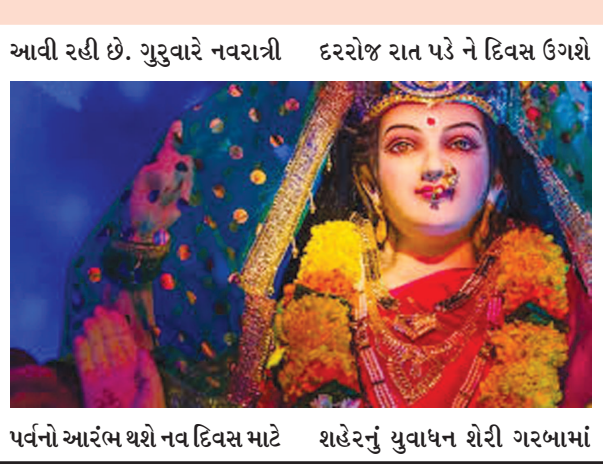
પર્વનો આરંભ થશે નવ દિવસ માટે શહેરનું યુવાધન શેરી ગરબામાં

આવી રહી છે. ગુરુવારે નવરાત્રી દરરોજ રાત પડે ને દિવસ ઉગશે