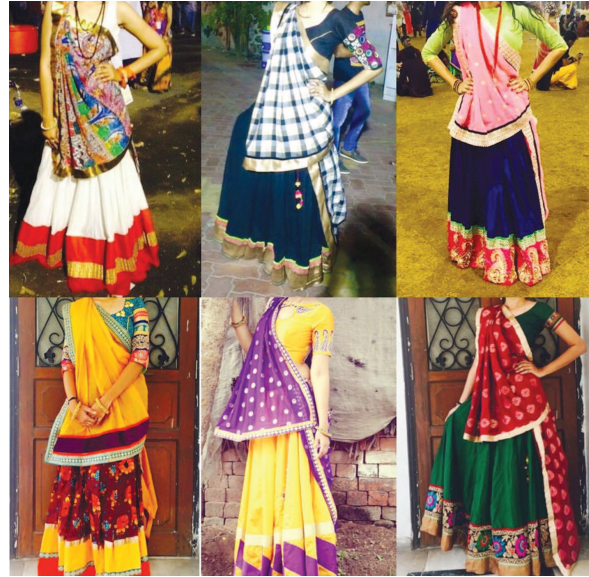
સિઝન થઈ શરૂ કરી શ્રી ખરીદીનો કરંટ બજારમાં જોવા મળશે અને શહેરના બજારોમાં ટ્રેડિશનલનો વેપાર કરતા વેપારીઓને નફો થતો જોવા

ગરબા રમવા માટેની મંજૂરી મળતા વેપારીઓએ છેલ્લી ઘડીએ નવી ડિઝાઇનના ટ્રેડિશનલ ડ્રેસ તૈયાર કરાવ્યા છે. સરકારે ગરબા રમવા માટે નિર્ણય લીધો ન હોતો પરંતુ જ્યારે સોસાયટીઓ અને શેરી ગરબા માટે રમવાની મંજૂરી આપતા સ્થાનિક વેપારી નવો સ્ટોક તૈયાર કરાવવા માટે તેમના ડિઝાઇનરને ઓર્ડર આપ્યા હતા. નવી ડિઝાઇનમાં બાંધણી, બાટિક, પટોળા ટિલ્ટના ટ્રેડિશનલ ડ્રેસીસ મળી રહ્યા છે. કચ્છી ચણિયાઓની બનાવવા માટે સમય લાગતો હોવાથી ગયા વખતનો સ્ટોક જ વેપારીઓએ વેચાણમાં મુક્યો છે.