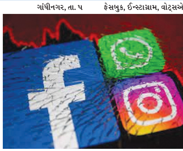
ઈન્સ્ટાગ્રામ અને વોટ્સએપ બંધ થઈ ગયું હતું. માત્ર ટ્વીટર જ ચાલુ રહ્યું હતું.

આજકાલ સોશીયલ મીડિયાનો જમાનો છે. કેટલાક યુવાનો સતત તેની સાથે જોડાયેલા રહે છે. ગઈકાલે રાત્રે છ કલાક નેટ બંધ રહેતા સોશીયલ મીડિયા જાણે થંભી ગયું હતું. રાત્રે ૯ થી ૩ વાગ્યા સુધી નેટ બંધ રહેતા જાતભાતના તર્ક-વિતર્કો થયા હતા તથા કેટલાક યુવાનોએ બેચેની અનુભવી હતી. સોશીયલ મીડિયાનું આજકાલ સૌને ઘેલુ લાગ્યું છે. બાળકોથી માંડી યુવાનો, મહિલાઓ અને વડીલો સુધી સોશીયલ મીડિયાનો ઉપયોગ કરતા થયા છે. એક આખું વિષય મોબાઇલની સ્ક્રીન પર આવી જાય તેટલું આ મીડિયા પાવરફૂલ બનતું જાય છે. નેટના આધારે ચાલતા સોશીયલ મીડિયાના