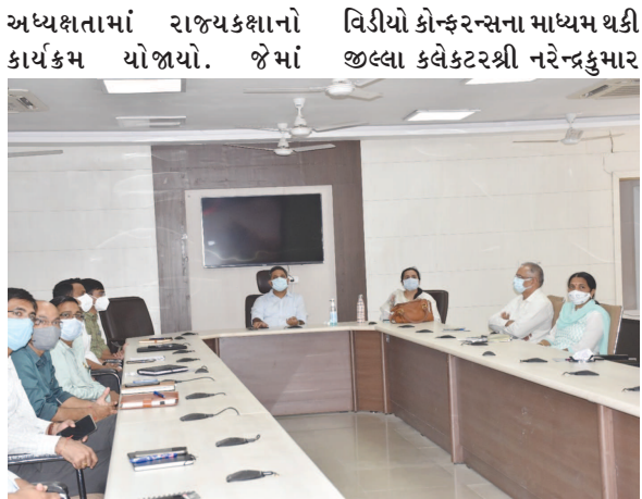
મોડાસા તા.૮ ગુજરાતના સમૃદ્ધ વન્યજીવ વારસાને જાળવી રાખવા માટે રાજ્ય સરકારે અનેક સંરક્ષણાત્મક પગલા લીધા છે. જેમાં ગુજરાત રાજ્ય વન્ય પ્રાણી સંરક્ષણ અને સંવર્ધન ક્ષેત્રે મોખરાનું સ્થાન ધરાવે છે. જેથી રાજ્યમાં રાષ્ટ્રપિતા મહાત્મા ગાંધીની જન્મ જયંતિ ૨ ઓક્ટોબર થી શરૂ કરીને ૮ ઓક્ટોબર સુધી એક સમાહના સમય ગાળામાં “વન્ય પ્રાણી સમાહ” ઉજવણી ઉત્સાહ અને ઉમંગપૂર્વક કરવામાં આવી છે.

મોડાસા તા.૮ ગુજરાતના સમૃદ્ધ વન્યજીવ વારસાને જાળવી રાખવા માટે રાજ્ય સરકારે અનેક સંરક્ષણાત્મક પગલા લીધા છે. જેમાં ગુજરાત રાજ્ય વન્ય પ્રાણી સંરક્ષણ અને સંવર્ધન ક્ષેત્રે મોખરાનું સ્થાન ધરાવે છે. જાગૃતતા એ સંરક્ષણ માટેનું સોપાન છે. જેથી રાજ્યમાં રાષ્ટ્રપિતા મહાત્મા ગાંધીની જન્મ જયંતિ ૨ ઓક્ટોબર થી શરૂ કરીને ૮ ઓક્ટોબર સુધી એક સમાહના સમય ગાળામાં “વન્ય પ્રાણી સમાહ” ઉજવણી ઉત્સાહ અને ઉમંગપૂર્વક કરવામાં આવી છે. જે અંતર્ગત રાજ્યના મુખ્યમંત્રીશ્રી ભુપેન્દ્રભાઈ પટેલની અરવલ્લીમાં જીલ્લા કક્ષાના કાર્યક્રમમાં કલેક્ટર કચેરી ખાતેથી મીના આ કાર્યક્રમમાં ઉપસ્થિત રહ્યા હતા.