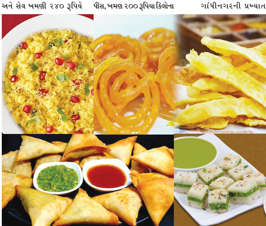
કિલો, સમોસા ૧૫ રૂપિયા પર ભાવે મળી રહ્યા છે. ફરસાણ અને સ્વીટસની દુકાનોમાં

ગાંધીનગર, તા. ૧૦ ગરબા પછી પેટપૂજા એ નવરાત્રિ દરમિયાન તમામ ખેલેયાઓનું રૂટિન બની જાય છે. લાંબા સમય સુધી નોનસ્ટોપ ગરબા રમવાથી ભૂખ લાગે છે ત્યારે ખેલેયાઓ ગરમાગરમ નાસ્તાઓના સ્ટોલમાં જતા હતા. પરંતુ આ વર્ષે માત્ર શેરી ગરબા થવાથી શેરીઓમાં તથા સોસાયટીઓમાં ગરબા સંચાલકો દ્વારા નાસ્તાનું આયોજન કરવામાં આવ્યું છે.