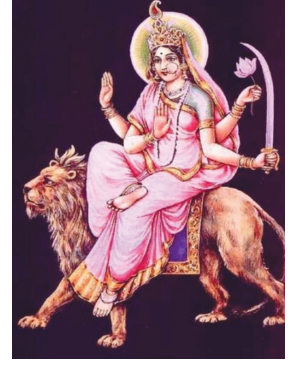
સુધી માં ભગવતીની ઉપાસના કરી હતી અને એમની ઈચ્છાથી મં

આવશે. ઋષિ કાત્યાના ગોત્રમાં વિશ્વ પ્રસિધ્ધ મહર્ષિ કાત્યાયન જન્મ્યા હતા. જેમણે ઘણા વર્ષો