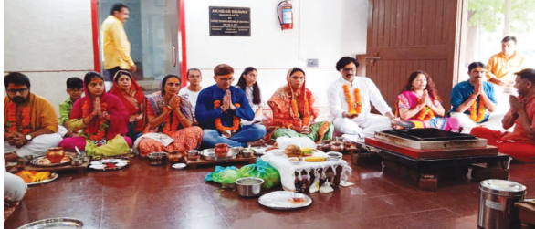
ગાંધીનગરના સેક્ટર-૧ ૧ માં અખબારભવન ખાતે નવરાત્રીના પાવન અવસરે આજે નવચંડી પાઠ હોમ યોજાયાં આયોજન કરવામાં આવ્યું હતું. આ પ્રસંગે મોટી સંખ્યામાં શહેરના પત્રકારો તથા અખબાર ભવન ખાતે કાર્યરત પ્રેસ-મિડીયાના સંચાલકો તેમજ કર્મચારીઓ વગેરે પરિવાર સાથે મોટી સંખ્યામાં ઉપસ્થિત રહ્યાં હતા તેમજ હવનમાં આહુતિ અર્પણ કરવા સાથે આયોજિત પ્રસાદ ભોજનનો પણ લાભ લીધો હતો.