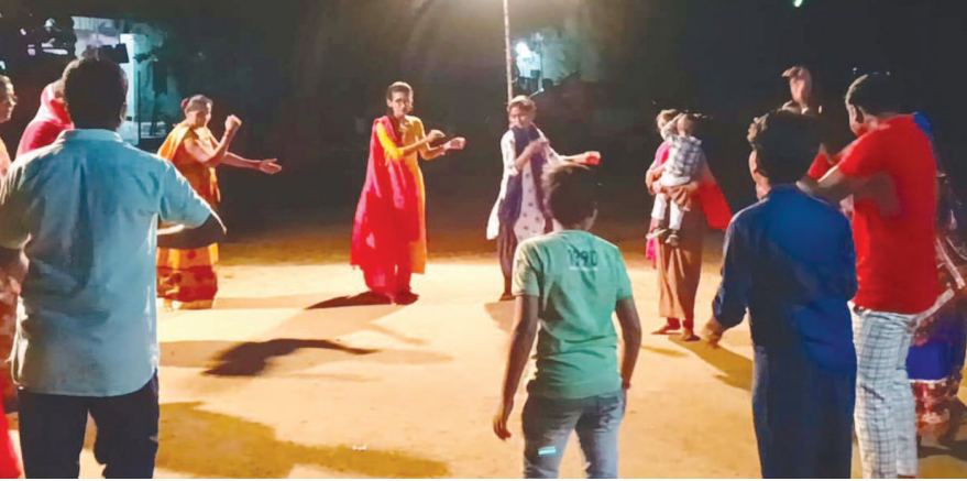
સેક્ટર-૭-એ વસાહત મંડળ દ્વારા નવરાત્રી નિમિત્તે ગરબા મહોત્સવનું આયોજન કરવામાં આવ્યું છે. આ વર્ષે પાર્ટી પ્લોટના ગરબાનું આયોજન થયું ન હોવાથી શેરી ગરબામાં ખૂબ જ મોટી સંખ્યામાં વસાહતીઓ ઉમટી પડે છે અને ભાવપૂર્વક ગરબામાં જોડાય છે.