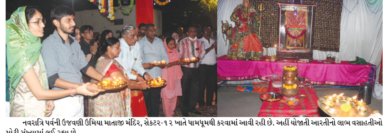
નવરાત્રિ પર્વની ઉજવણી ઉમિયા માતાજી મંદિર, સેક્ટર-૧૨ ખાતે ધામધૂમથી કરવામાં આવી રહી છે. અહીં યોજાતી આરતીનો લાભ વસાહતીઓ મોટી સંખ્યામાં લઈ રહ્યા છે.

ગાંધીનગર, તા. ૧૦ ગુજરાત રાજ્ય કાનૂની સેવા સત્તા મંડળ તેમજ જિલ્લા કાનૂની સેવા સત્તા મંડળ, ડિસ્ટ્રીક્ટ એન્ડ સેશન્સ કોર્ટ ગાંધીનગરના સંયુક્ત ઉપકમે સે-૨૫ ખાતે આવેલ જય ગોપા હોસ્ટેલ (બોયઝ હોસ્ટેલ) ગાંધીનગરમાં એક કાનૂની જાગૃતિ શિબિરનું આયોજન મહાત્મા ગાંધી જન્મજયંતિના રોજ કરવામાં આવ્યું હતું.