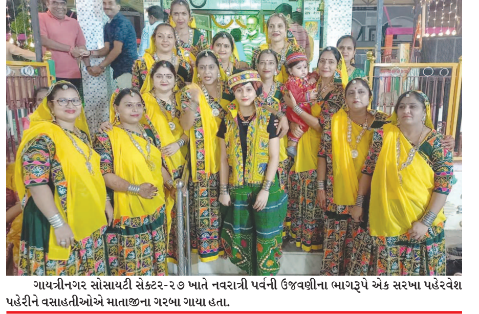
ગાયત્રીનગર સોસાયટી સેક્ટર-૨૭ ખાતે નવરાત્રી પર્વની ઉજવણીના ભાગરૂપે એક સરખા પહેરવેશ પહેરીને નૃસાહતીઓએ માતાજીના ગરબા ગાયા હતા.

ગાંધીનગર તા ૧૩ કરોલીની એન એમ પટેલ સરસ્વતી વિદ્યાલયમાં ફરજ બજાવતા શિક્ષણ સહાયકને સેવા મુકત કરવાના આદેશને જિલ્લા શિક્ષણાધિકારીએ રદ કર્યા બાદ શિક્ષકોને હાજર થવા દેવાના મુદ્દે શાળા કક્ષાએથી ના પાડી દેવાતા આ મામલે વિવાદ હજુ યથાવત રહ્યો છે. એકવાર જિલ્લા શિક્ષણાધિકારીને રજૂઆત કરવામાં આવી છે. મહીલા શિક્ષણ સહાયકને નોકરી માટે કયા સ્થળે હાજર થવું તેવા પ્રશ્ન સાથે શિક્ષણાધિકારીને રજૂઆત કરી છે. દહેગામ તાલુકાની કરોલી ગામની એન એમ પટેલ સરસ્વતી વિદ્યાલયમાં મહીલા શિક્ષકોને માનસિક ત્રાસ આપવાના મામલે કેળવણી મંડળ અને શાળાના ઈન્ચાર્જ આચાર્યની વિરુદ્ધ મહીલા આયોગ અને શાળાઓના કમિશ્નરની કચેરીમાં પણ રજૂઆત કરવામાં આવી હતી. પરંતુ આ મામલે આગળ કાર્યવાહી થાય તે પુર્વે જ કરોલી કેળવણી મંડળે મહીલા શિક્ષણ સહાયકની સેવામાંથી મુકિત કરવાનો આદેશ કર્યો હતો. જ્યારે આ મામલે મહીલા