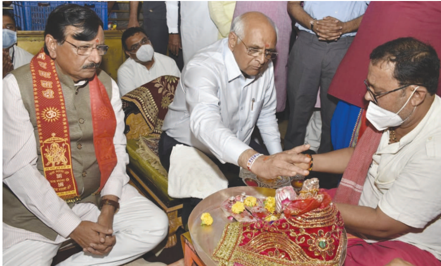
મુખ્યમંત્રી ભુપેન્દ્ર પટેલ મહાઅષ્ટમીના પાવર પર્વે આઘશક્તિ અંબાજીના આશીર્વાદ લેવા દર્શને પહોંચ્યા હતા. પૂજન-અર્ચન કરી ધન્યતા અનુભવી હતી. આ સમયે મંત્રીશ્રી બ્રિજેશ મેરજ પણ પૂજન-અર્ચનમાં જોડાયા હતા.

મોનીટરીંગ કરવા પર ભાર મુક્યો હતો. સ્વચ્છતા મિશન અંતર્ગત આવી રહેલ સ્વચ્છતા સર્વેક્ષણ-૨૦૨૧ ને ધ્યાને રાખી વધુ ને વધુ લોકો એપ ડાઉનલોડ કરે તેમજ ગ્રામ્ય વિસ્તારમાં નિયમિત રીતે સફાઈ થાય તે જોવા તેમણે જણાવ્યું હતું. તેમણે કહ્યું કે પર્વોમાં ઉજવણી પુરતુ સ્વચ્છતા અભિયાન નહિ પણ સ્વચ્છતાનો અભિગમ ટેવ બને તે જોવું જોઈએ.