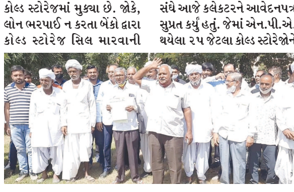
તજવીજ હાથ ધરાઈ છે. ત્યારે ખેડૂતોના નામે કોલ્ડ સ્ટોરેજના માલિકોના વ્યારે આવતા કિસાન

પાલનપુર તા. ૧૭ બનાસકાંઠા જિલ્લામાં કોલ્ડ સ્ટોરેજના માલિકોએ લીધેલી લોન ભરપાઈ ન કરતા બેંકો દ્વારા કોલ્ડ સ્ટોરેજ સિલ કરવાની તજવીજ હાથ ધરાઈ છે. ત્યારે કોલ્ડ સ્ટોરેજને સિલ કરવા સામે વિરોધ દર્શાવતા કિસાન સંઘે કલેક્ટરને આવેદનપત્ર આપ્યું હતું. બનાસકાંઠા જિલ્લામાં મોંઘા ભાવના બિયારણો ખરીદી ખેડૂતોએ બટાકાનું વાવેતર કર્યું હતું. જોકે, બટાકાનું ભમ્પર ઉત્પાદન થયું હતું. પરંતુ ભાવ ન મળતા ખેડૂતોએ પોતાના બટાકા