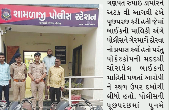
શામળાજી પોલીસ સ્ટેશન

બાયડ (બ્યુરો ઓફિસ) તા. ૧૭ અરવલ્લી જિલ્લામાં વાહન ચોરીના વધતા બનાવો વચ્ચે યાત્રાધામ શામળાજીમાં પુનમે વાહન ચોરતી ટોળકીના સાગરીતના પોલીસે ચોરાઈ બાઈક સાથે દબોચી લીધો છે. રાજસ્થાની વાહન ચોરે ૩ વર્ષમાં ૧૫ વાહન ચોરીના ગુના કબુલ્યા છે જેથી પોલીસ દ્વારા ૫,૦૦૦ નો સુદામાલ જપ્ત કરવામાં આવ્યો છે. વાહન ચોરીના અન્ય ભેદ ઉકેલવા માટે પોલીસે રા જસ્થાની ઈસમની આગવી ઢબે પૂછપરછ શરૂ કરતાં અન્ય એક નામ ખૂલ્યું છે. યાત્રાધામ શામળાજીમાં દર પુનમે અસંખ્ય શ્રદ્ધાળુઓ શામળાજી મંદિરમાં દર્શન માટે આવતા હોય છે. ભક્તોની ભીડ વચ્ચે ખિસ્સા સ્ટેશનમાં નોંધાયેલા હતા જેથી પોલીસ પુનમે મહિલાના ગળામાંથી સોનાના દોરા ખેંચનાર ગેંગ સાથે વાહન ચોર પણ ચોરીના બનાવોને અંજામ આપી રહ્યા છે. પુનમે શામળાજીમાં વાહનો પાર્ક કરવાની પણ જગ્યા ન મળે તેવી સ્થિતિથી વાહન ચોર સક્રીય રહેતા હોય છે. વર્ષ-૨૦૧૮ થી ૨૧ દરમિયાન વાહન ચોરીના અસંખ્ય બનાવ શામળાજી પોલીસ સ્ટેશનમાં નોંધાયેલા હતા જેથી પોલીસ પુનમે થતી વાહન ચોરીનો ભેદ ઉકેલવા માટે સક્રીય થઈ