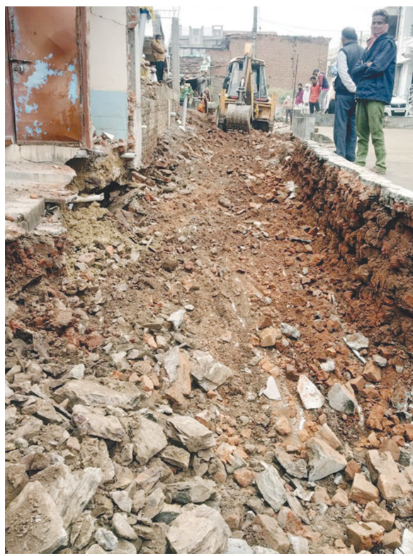
આવતા રસ્તા ઉપરના દબાણો તંત્ર એ દૂર કર્યા પછી ગણતરીના દિવસોમાં ફરીથી દબાણ થઈ જતાં તંત્રની યાક કેમ

મોડાસા, તા. ૧૭ મેઘરજ તાલુકાના નવાગામ (ઈસરી)ની નીચલી કળીમાં