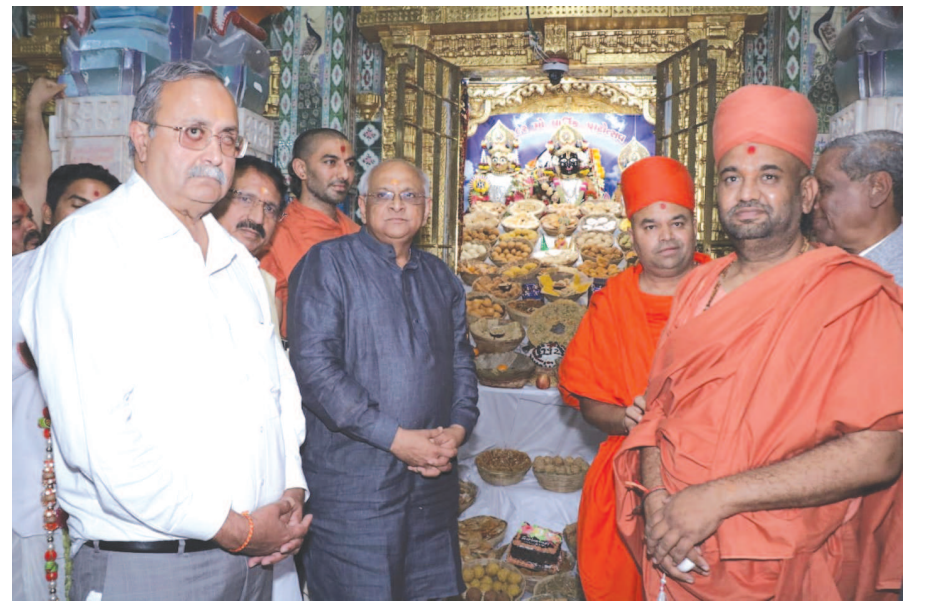
ગઢડા ખાતે બી.એ.પી.એસ. મંદિરે શ્રદ્ધાપૂર્વક દર્શન કરતાં મુખ્યમંત્રી ભૂપેન્દ્રભાઈ પટેલ

હળવા વરસાદની સંભાવના છે. મહત્તમ તાપમાન ૩૩-૩૪ સી રહેવાની આગાહી છે. આ વર્ષે પાછોતરા વરસાદમાં રાજ્યના મોટાભાગના નાના-મોટા જળાશયોમાં પાણીની સારી આવક થઈ છે ત્યારે શિયાળુ પાકમાં પણ ખેડૂતોને પાણીની તકલીફ નહીં પડે તેવી સંભાવના દેખાઈ રહી છે.