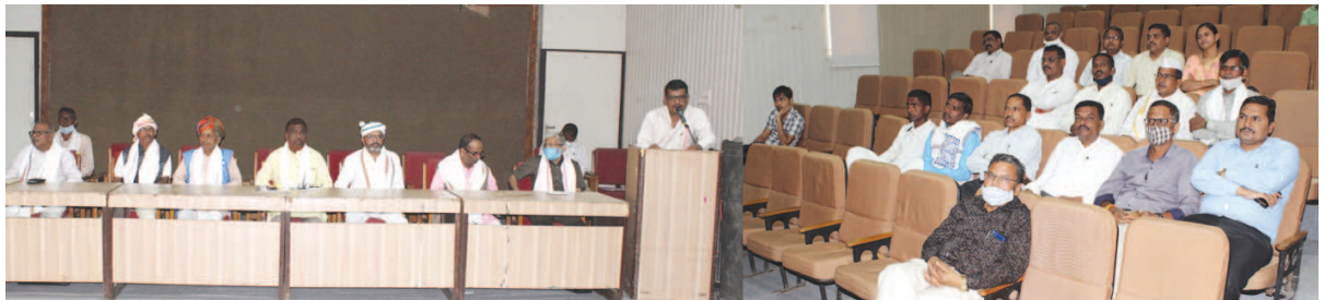
આદિવાસીઓની વસ્તી ગણતરી બાબતે ચર્ચા-વિચારણા કરવા ચિંતન શિબિરનું આયોજન સ્ટાક ટ્રેનિંગ કોલેજ, સેક્ટર-૧૭ ખાતે કરવામાં આવ્યું હતું. આદિજાતિઓની વસ્તી ગણતરી બાબતે ઉચ્ચકક્ષાએ રજૂઆત કરવાનો નિર્ણય પણ આ ચિંતન શિબિરમાં લેવાયો હતો.