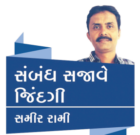
સંબંધ સજાવે જિંદગી સમીર રામી