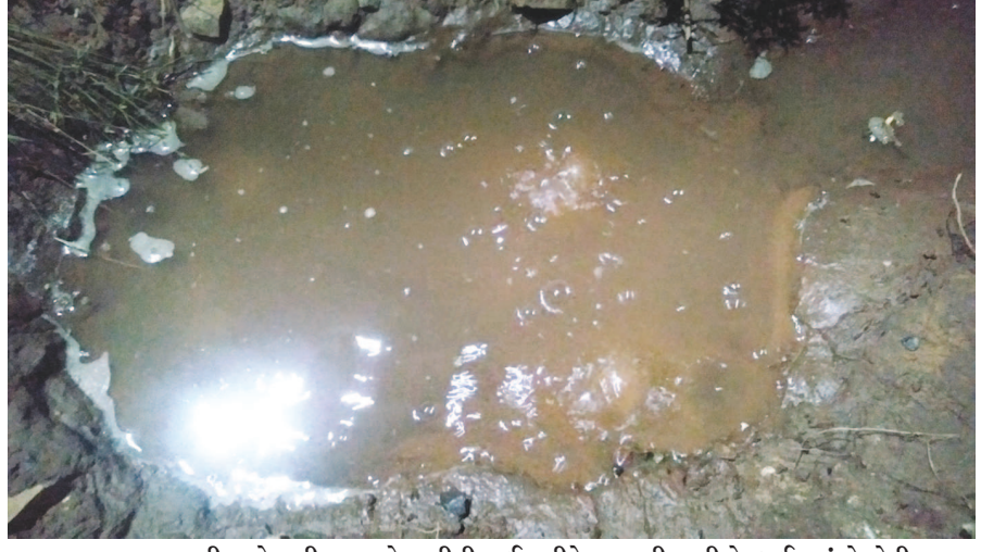
સત્યાગ્રહ છાવણી ખાતે રાત્રીના સમયે પાણીની પાઈપ લીકેજ થવાથી પાણી વેડફાઈ રહ્યું છે. તેથી કાદવ-ક્રીચડ અને ગંદકીના દેશ્યો સર્જાયા છે.