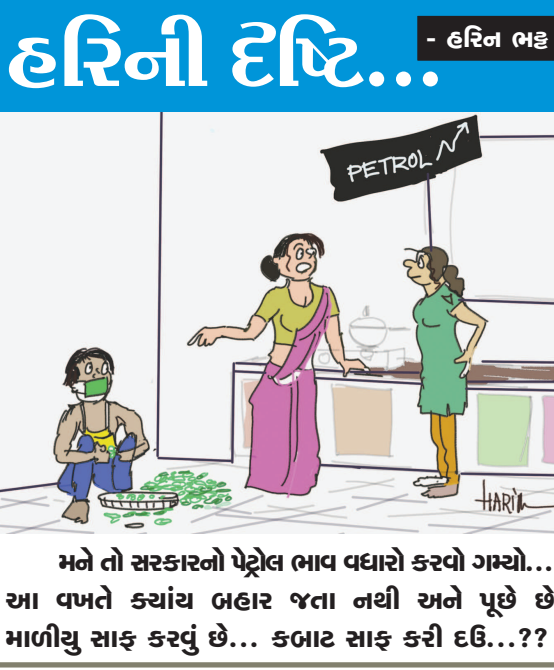
હરિની દષ્ટિ... - હરિન ભટ્ટ મને તો સરકારનો પેટ્રોલ ભાવ વધારો કરવો ગમ્યો... આ વખતે ક્યાંય બહાર જતા નથી અને પૂછે છે માળીયુ સાફ કરવું છે... કબાટ સાફ કરી દઉં...??