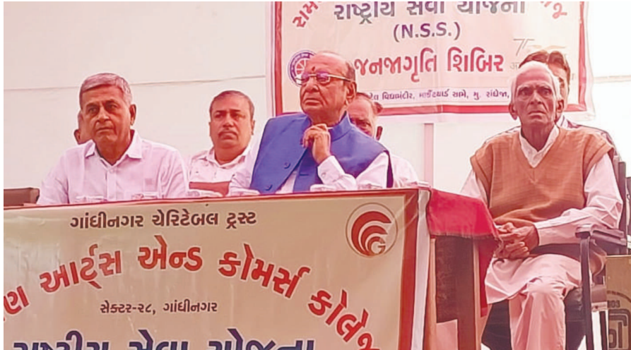
સમર્પણ આર્ટસ એન્ડ કોમર્સ કોલેજના એન.એસ.એસ.ના સ્વયંસેવકો દ્વારા રાંધેજા ખાતે ત્રિદિવસીય જન જાગૃતિ શિબિરનો રાજ્યના પૂર્વ મુખ્યમંત્રી અને ટ્રસ્ટના વડા શંકરસિંહ વાઘેલાએ આરંભ કરાવ્યો હતો. પૃથ્વી વધુ વિદ્યાર્થીઓ આ કેમ્પમાં ભાગ લઈ રહ્યા છે. જેમાં સ્વચ્છતા, આરોગ્યની કાળજી જેવા વિષયોને આવરી લઈ જન જાગૃતિ કરવામાં આવવાનું છે. આ ઉદ્દેશ્યને પ્રસંગે ગ્રામજનો, કોલેજના અધ્યાપકો તેમજ શિક્ષણપ્રેમીઓ મોટી સંખ્યામાં ઉપસ્થિત રહ્યા હતા.

ગાંધીનગર, તા. ૨૯ ગાંધીનગર નજીક આવેલા ચિલોડા જંકશન ખાતે છેલ્લા કેટલાક દિવસથી એક મહિલાને પગલે હોહા મચી ગઈ હતી. જેમાં નાગરીકોને જોઈ મહિલા પથ્થરો મારતા સ્થાનિક નાગરીકોમાં ભયનો માહોલ ઉભો થવા પામ્યો હતો. ત્યારે અસ્થિર મગજની મહિલાને ૧૮૧ હેલ્થ લાઈનની ટીમે ભારે જહેમત બાદ બાઇડ માનસિક વિશિષ્ટ ગૃહ ખાતે મોકલી આપી હતી. ચિલોડાની ચોતરફ ગમે તે સમયે નાના બાળકોને જોઈને પથ્થરો ફેંકી દોડીને જતી રહેતી હતી. જો કોઈ વ્યક્તિ તેનો પ્રતિકાર કરે તો તેના પર પણ મહિલા પથ્થરો ફેંકીને ભાગી જવાની વ્યાપક ફેરિયાદ સામે આવી હતી. આ મેલા ઘેલા કપડા પહેરીને ફરતી મહિલા પાસે જવાની કોઈની હિંમત ન હતી. કોઈ વ્યક્તિ મહિલાની નજીક જાય તો ગાળો બોલીને પથ્થરો ફેંકીને મારવાનું શરૂ કરતી હતી. જેથી ચિલોડામાં વસવાટ કરતા નાગરીકો પોતાના બાળકો ઘરની બહાર પણ મોકલતા ન હતા. ત્યારે ના છુટકે નાગરીકો દ્વારા ૧૮૧ અભયમ ની ટીમને જાણ કરી હતી. ટીમના સભ્યો સ્થળ પર દોડી ગયા હતા, તે સમયે મહિલાએ ટીમના સભ્યોને પણ ગમે તેમ બોલીને પથ્થર ઉઠાવી લીધો હતો. ત્યારે મહિલા ટીમની સભ્ય દ્વારા મહિલાને પકડી ગુસ્સો શાંત થયા પછી વાત કરી હતી. પરંતુ ટીમના સભ્યોને કોઈ માહિતી પ્રાપ્ત થઈ ન હતી. આખરે માનસિક રીતે વિશિષ્ટ મહિલાને બાયડ મંદબુધ્ધી સમાજ સેવા ટ્રસ્ટના આશ્રય ગૃહ ખાતે મોકલી આપવામાં આવી હતી.