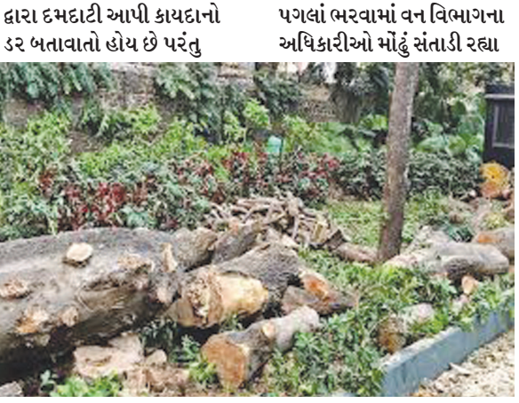
લીલાં વૃક્ષોનું નિકંદન કાઢવા બેઠેલા તલ્તો સામે કાયદાકીય

વિસ્તાર તેમજ આરક્ષિત જંગલ વિસ્તારમાંથી લીલાં વૃક્ષો ગાયબ થઈ રહ્યાં છે. જિલ્લામાં છેલ્લા કેટલાય સમયથી લીલાં વૃક્ષોની કલ્પેઆમ કરનારા વિરુદ્ધનો વન વિભાગે છટો પરવાનો આપી દીધો હોય તેવી સ્થિતિ પ્રવર્તી રહી છે. વૃક્ષો કાપવા માટે ઓનલાઈન અરજી ફરજિયાત હોવાનો નિયમ બનાવવામાં આવ્યો છે પરંતુ ક્યાંય તેનો અમલ થતો નથી. જંગલ વિસ્તારમાંથી મહિલાઓ સૂકાં લાકડાં એકત્ર કરવા જાય ત્યારે ફોરેસ્ટર તેમજ બીટ ગાર્ડ