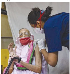
નમૂના લઈ પરિક્ષણ માટે મોકલવામાં આવ્યા છે. મળતી વિગતો પ્રમાણે આર.ટી.પી.સી.આર. ટેસ્ટમાં ગાંધીનગરમાંથી ૨૧,૮૧૭ નમૂના, હલેગામમાંથી ૩૨,૬૨૮ નમૂના, માણસામાંથી ૩૩,૮૧૧ નમૂના અને કલોલમાંથી ૨૭,૧૦૮ નમૂના મેળવી પરિક્ષણ માટે મોકલવામાં આવ્યા હતા.

ગાંધીનગર, તા. ૧ ગાંધીનગર જિલ્લાના ગ્રામ્ય વિસ્તારમાં ૧-૫-૨૦ થી ૩૧-૮-૨૧ ના સમયગાળા દરમિયાન ૪,૫૮,૫૭૪ લોકોના કોરોના માટે ટેસ્ટ કરવામાં આવ્યા છે. આ પૈકી ૧,૫૮,૭૫૮ લોકોના આર.ટી.પી.સી.આર. ટેસ્ટ અને ૨,૯૯,૮૧૫ લોકોના રેપીડ એન્ટીજન ટેસ્ટ કરવામાં આવ્યા છે. જિલ્લાના ગ્રામ્ય વિસ્તારમાં ૮૬૬૨ દર્દીઓ કોરોનામુક્ત થયા છે. જિલ્લામાં કોરોનાનું સંક્રમણ ઘટી ગયું છે. જિલ્લાના ગ્રામ્ય વિસ્તારમાં કોરોનાના કેસો છેલ્લા ૨૧ દિવસથી નોંધાયા નથી. જો કે ટેસ્ટીંગ કરવાની કામગીરી ચાલુ હોવાનું તંત્રના સૂત્રોએ સ્વીકાર્યું છે. જિલ્લામાં આજે પણ ૭૦૦ થી વધુ લોકોના આર.ટી.પી.સી.આર. ટેસ્ટ માટે