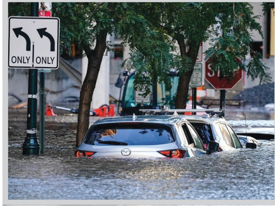
ન્યૂયોર્ક, તા. ૩ અમેરિકાના ન્યૂયોર્ક શહેરમાં આવેલા ભારે વરસાદના કારણે પૂરની સ્થિતિનું નિર્માણ થયું

મૃત્યુઆંક ૪૧ પર પહોંચ્યો : ન્યૂયોર્કના અનેક ઘરોમાં પાણી ફરી વળ્યાં, કારો તણાઈ ગઈ : ન્યૂયોર્કમાં એફડીઆર ડ્રાઈવ અને બોક્સ રિવર પાર્ક સ્વિમિંગ પુલ બની ગયા, સબવે સ્ટેશનો અને રેલવેના પાટાઓ પર વરસાદનાં પાણી ફરી વળ્યાં