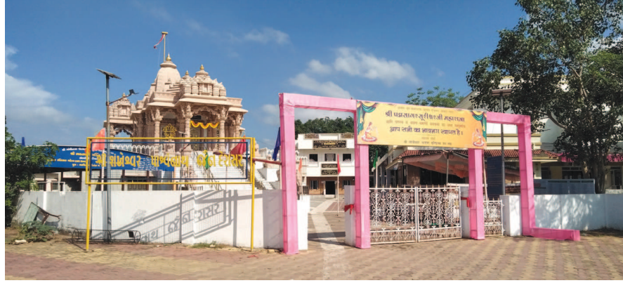
વિશિષ્ટ સૂત્રો કંઠસ્થ કરવા સાથે, મુખ્ય આરાધનાઓને સાંકળી પર્વપૂજા પર્વના દિવસોમાં વિવિધ માંગલિક કાર્યક્રમોનું આયોજન કરેલ છે. જેમાં ગઈ કાલે આજે સવારે ૯.૦૦ કલાકે અષ્ટાન્ધિકા પ્રવચનનું આયોજન છે. જેમાં કલ્પસૂત્રની અષ્ટપ્રકારી

કલાકે કલ્પસૂત્ર વાંચન અને બપોરે ૨.૪૫ કલાકે સ્થિરાવલી વાંચન રાખેલ છે. શુક્રવારે સવારે ૯.૪૫ કલાકે બારસા સૂત્ર વાંચન, ફોટા દર્શન, બાદમાં દહેરાસરજીમાં પ્રભુદર્શન ચૈત્યવંદન કાર્યક્રમ અને બપોરે ૨.૪૫ કલાકે સંવત્સરી પ્રતિક્રમણ અને સામૂહિક ક્ષમાપના. શનિવારે સવારે ૯.૧૫ કલાકે તપસ્વીઓના સામૂહિક પારણા અને રવિવારે ૧૨ તારીખે સવારે ૯.૪૫ કલાકે તપ અનુમોદનાની શોભાયાત્રા તથા સંઘ સ્વામિવાત્સલ્ય જેમાં શોભાયાત્રા દેરાસરથી પ્રયાણ કરી પરત થતાં પ્રભુજીના પોંખણના ચડાવા કરવામાં આવશે.