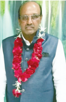
ઉમેદવારીપત્ર રજૂ ન થતાં બંને ઉમેદવારો ચેરમેન-વાઈસ ચેરમેન તરીકે ચૂંટાઈ આવ્યા હતા.