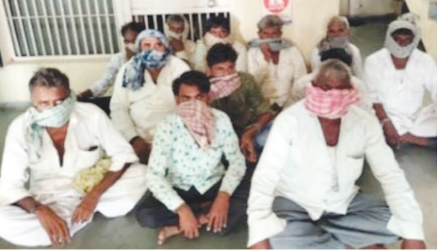
હાજરી આપવા આવેલા સુરેન્દ્રનગર, બાવળા અને વડોદરાના કેટલાક ઈસમો ખુલ્લા ખેતરમાં પરોટે જુગારની બાજી માંડીને બેઠા હોવાની ખાતમીના આધારે પોલીસે છાપો મારતાં ૧૨ જુગારી ઝડપાયા. ૨૦૨૦ના મુદ્દામાલ સાથે રંગેહાથે ઝડપાતાં લોકઅપમાં ધકેલ્યા છે. હારજીતના જુગારમાં પતાના શોખીનો મસ્ત હતા તે સમયે પોલીસ ત્રાટકતાં નાસભાગના દ્રશ્યો સર્જ્યા હતા. બનાવ અંગે માલપુર પોલીસે જુગારધારા હેઠળ ગુનો નોંધી તપાસ શરૂ કરી છે.

પોલીસની ટીમ દ્વારા જુગાર સ્થળે ઓશિતિ રેડ કરવામાં આવતાં ૧૨ જુગારી ઝડપાઈ ગયા હતા. જુગારની રમતમાં