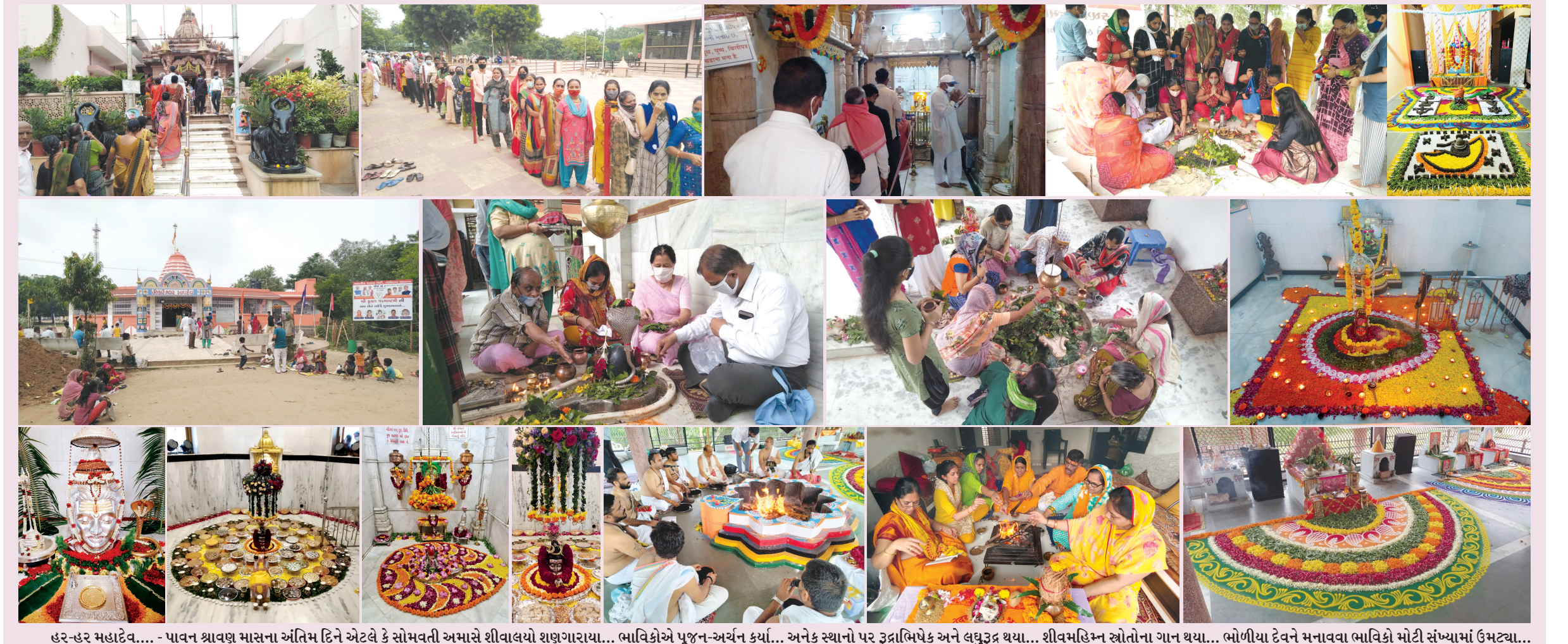
હર-હર મહાદેવ.... - પાવન શ્રાવણ માસના અંતિમ દિને એટલે કે સોમવતી અમાસે શીવાલયો શણગારાયા... ભાવિકોએ પૂજન-અર્ચન કર્યાં... અનેક સ્થાનો પર રૂદ્રાભિષેક અને લઘુરૂદ્ર થયા... શીવમહિમ સ્તોત્રોના ગાન થયા... ભોળીયા દેવને મનાવવા ભાવિકો મોટી સંખ્યામાં ઉમટવા... અને શિવજીને અંતરણના ઉદાણથી અરજ કરી કે, અમારા દેશને, અમારા સમાજને રોગચાળાથી મુક્ત રાખજો... જીવને ઉત્સવ બનાવવા અનુકૂળતા આપજો... અને સૌનું કલ્યાણ થાય એવા ભાવને પ્રસરાવજો... શહેરના શીવાલયો હર હર મહાદેવના નાદથી ગુંજી ઉઠ્યા હતા...