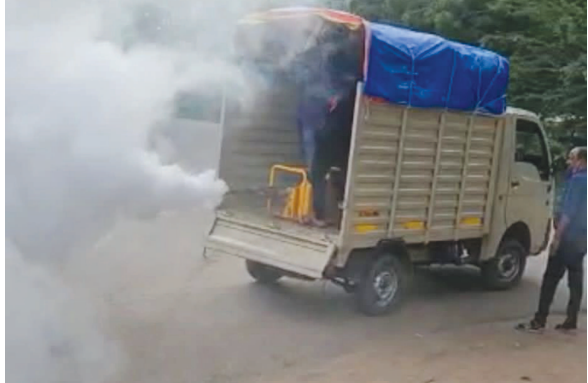
● અનુસંદાન પાન-૭ પર

ગાંધીનગર, તા. ૬ ગાંધીનગર શહેરમાં વાહકજન્ય રોગચાળો નિયંત્રણમાં રહે અને શહેરમાં વધતી જતી મચ્છરોની કેન્સીટીને ધ્યાને રાખી મનપાના તંત્રએ વ્હીકલ માઉન્ટેડ ફોગીંગ મશીનની ખરીદી કરી છે. આજે આ વ્હીકલ માઉન્ટેડ ફોગીંગ મશીન ગાંધીનગર મનપાને મળી ગયું છે અને તેનો દ્વાર્યલ પણ લેવામાં આવ્યો હતો. કાલથી આ મશીન જાહેર રસ્તાઓ પર ફોગીંગની કામગીરી હાથ ધરશે તેમ મનાઈ રહ્યું છે. ગાંધીનગર વિસર્જન મનપાના કાર્ટ્સીલરો માઉન્ટેડ