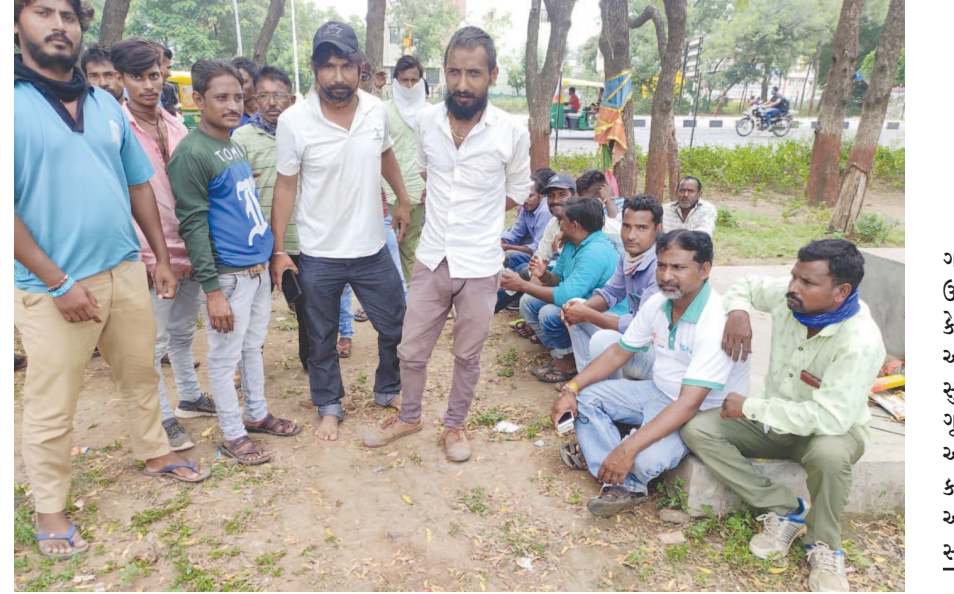
એજન્સીએ છુટા કરેલા સફાઈ કામદારો માટે 'આપ'નું આવેદનપત્ર

ચૂકવવામાં નિષ્ફળ જાય તો મૂળ રકમ (Base price)ને જમ કરવામાં આવશે. ફરીવાર હરાજી કરાવવામાં આવશે. ઓનલાઈન ઓક્શન દરમ્યાન અરજદારે આરબીઆઈ દ્વારા નક્કી કરેલ દરે ચાર્જ ચૂકવવાનો રહેશે. ટુ-વ્હીલર તથા ફોર- વ્હીલર માટે સિલ્વર નંબર તથા ગોલ્ડ નંબર માટે જરૂરી Base price ચૂકવવાની રહેશે. હરાજીની પ્રક્રિયામાં સફળ થયેલાં અરજદારને સફળ ગણી બાકીના નાણાં-દિન-પ (પાંચ)માં ભરપાઈ કરવા માટે SMS કે E-mail થી જાણ કરવામાં આવશે. હાલની મેન્યુઅલ પદ્ધતિ પ્રમાણે નાણાં પરત કરવાના રહેશે. એટલે કે, Net Banking, credit/ Debit card થી ચૂકવણું કર્યું હશે તો તે જ Mode થી નાણાં અરજદારના ખાતામાં SBI-epay દ્વારા પરત કરવામાં આવશે. જો આ નિયત સમય મર્યાદામાં નાણાં