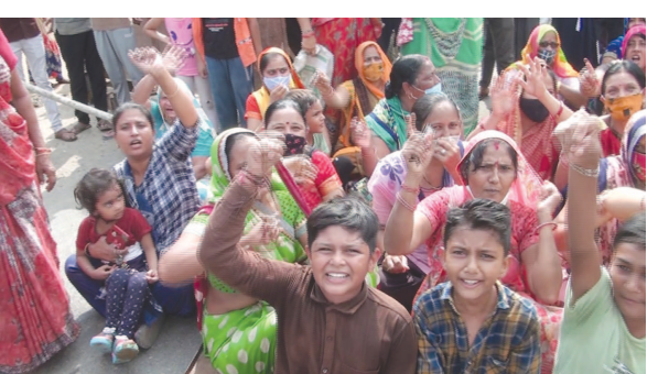
સર્વિસ રોડની કોઈ સુવિધા ના આપતા આજે મહિલાઓ રજાચંડી બની હતી અને મહિલા રેલવે ઓવર બ્રિજ ના રસ્તા પર સૂઈ જતા તેમ જ રસ્તા રોકો આંદોલન કરતાં ભારે ટ્રાફિક જામના દશ્યો સર્જયા હતા અને અનેક વાહનચાલકો આ ટ્રાફિકમાં અટવાયા મહિલાઓની એક જ માંગ હતી સર્વિસ રોડ અને

મીડિયા સાથેની વાતચીતમાં જણાવ્યું હતું કે આ મહિલા આંદોલન કરી રહી છે તે યોગ્ય અને સરકાર આ બાબને નહિ સાંભળે અને સર્વિસ રોડની સુવિધા નહીં આપે તો અમારે કોંગ્રેસના અગ્રણીઓએ પણ રસ્તા પર ભારે આંદોલન કરવાની જરૂર પડશે અત્યારે તો મહિલાઓએ સમજાવટ બાદ મહિલાઓ રસ્તા પરથી હટી જતા પોલીસે કલાકોની જહેમત બાદ ટ્રાફિક દૂર કરી વાહન વ્યવહાર શરૂ કરાયો પરંતુ મહિલાઓ સાથે સાથે ચીમકી પણ ઉચ્ચારી છે કે જો દસ દિવસના અમારી માંગ પૂરી કરવામાં નહીં આવે તો અમે ફરીવાર આના કરતાં પણ ઉચ્ચ આંદોલન કર્યું લોકાર્પણના માત્ર ૨૪ દિવસ જટલા ટૂંકા સમયગાળામાં જ આ પુલ વિચ્છાદિત બની ગયો છે પુલની આજુબાજુ સર્વિસ રોડના બનાવના વાહનચાલકો પણ ખૂબ જ મુશ્કેલી નો સામનો કરી રહ્યા છે અને રેલવેનો જૂનો પુલ પણ તોડી પડતા ટ્રાફિકની સમસ્યા તે ફરીવાર માથું ઉચ્ચક્યું છે.