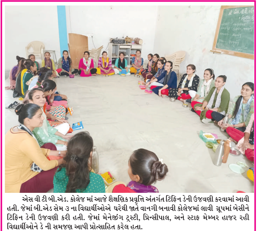
એસ વી ટી બી. એડ. કોલેજ માં આજે શૈક્ષણિક પ્રવૃત્તિ અંતર્ગત ટિફિન ડેની ઉજવણી કરવામાં આવી હતી. જેમાં બી.એડ સેમ ડના વિદ્યાર્થીઓએ ઘરેથી જાતે વાનગી બનાવી કોલેજમાં લાવી ચૂપમાં બેસીને ટિફિન ડેની ઉજવણી કરી હતી. જેમાં મેનેજીંગ ટ્રસ્ટી, પ્રિન્સીપાલ, અને સ્ટાફ મેમ્બર હાજર રહી વિદ્યાર્થીઓને ડેની સમજણ આપી પ્રોત્સાહિત કરેલ હતા.

થવાથી પારાવાર ગંદકીના કારણે મચ્છરોનો ઉપદ્રવ વધી જતાં ડેન્ગ્યુ તેમજ મેલેરિયાના કેસ બહાર આવી રહ્યા છે પરંતુ આરોગ્ય વિભાગની સર્વેલન્સ ટીમો દ્વારા માત્ર રોગચાળાથી પ્રભાવિત વિસ્તારો સુધી દવા છંટકાવની કામગીરી સિમિત રાખવામાં આવતી હોય છે જેના કારણે અન્ય નવા વિસ્તારો રોગચાળાની રૂપેટમાં આવી રહ્યા છે. માત્ર શહેરી વિસ્તારોમાં પાલિકા તંત્ર અને આરોગ્ય વિભાગના પ્રયાસોથી ફોર્ગીંગ મશીન દ્વારા મચ્છરોનો ઉપદ્રવ નાથવાની કામગીરી થતી હોય છે. જ્યારે ગ્રામ્ય વિસ્તારમાં તો મચ્છરજન્ય રોગચાળાને અટકાવવાની કામગીરી પાસેરામાં પૂણી બરાબર સાબિત થઈ રહી છે.