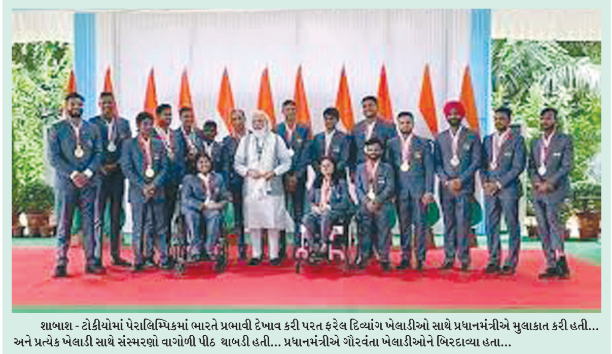
શાબાશ - ટોકીયોમાં પેરાલિમ્પિક્સમાં ભારતે પ્રભાવી દેખાવ કરી પરત ફરેલ દિવ્યાંગ ખેલાડીઓ સાથે પ્રધાનમંત્રીએ મુલાકાત કરી હતી... અને પ્રત્યેક ખેલાડી સાથે સંસ્મરણ વાગોળી પીઠ થાબડી હતી... પ્રધાનમંત્રીએ ગૌરવતા ખેલાડીઓને બિરદાવ્યા હતા...

સીબીટીની અખબારી યાદીમાં જણાવાયું છે કે, વર્ષ ૨૦૨૧-૨૨ના રિટર્ન ૩૧ ડિસેમ્બર સુધીમાં ભરી શકાશે. કોરોનાની બીજી લહેરને કારણે ઘણા બધા વેપાર - વ્યવસાયને રોજીંદા વ્યવહારોમાં હાલાકી સર્જાઈ હતી. જેના કારણે હિસાબો તૈયાર કરવામાં વિલંબ થયો હોવાની રજૂઆત કરતા સીબીટીએ આજે તારીખ લંબાવવાનો આખરી નિર્ણય કર્યો હતો.