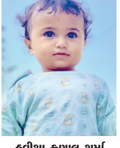
હવીશા કુશલા શર્મા હરિપાર્ક સોસાયટી, બાયડ