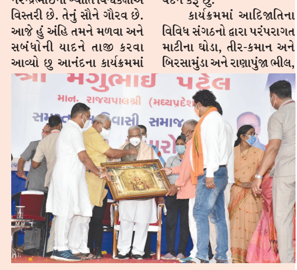
શ્રી મંગુભાઈ પટેલ માન. રાજ્યપાલશ્રી (મધ્યપ્રદેશ) આદિવાસી સમાજને આશીર્વાદ આપી રહ્યા છે.

રમીલાબેન બારા અને અદના કાર્યકર મને રાજ્યપાલ તરીકેનું પદ આપીને આદિવાસી સમાજનું ગૌરવ વધાર્યું છે. તેને જવાબદારી પૂર્વક સારી રીતે નિભાવવાની નેમ વ્યક્ત કરી હતી કામમાં અડગ રહો, સારા કામ કરતા રહો નાના માણસનું કામ કરો, ખોટું કરો નહિ, ભગવાનની કૃપા તમારા પર રહેવાની છે. બંધ મકાનમાં નાનું છિદ્ર હોય તો પ્રકાશ આપો આપ પથરાશો. તેમ જણાવી નિરાશ થયું નહિ, તમારા કર્મનું ફળ તમને મળશે સૌથી વધુ આદિવાસી વસતી ધરાવતો અને જંગલ વિસ્તાર એટલે મધ્યપ્રદેશ ગુજરાતની જેમ ત્યાં પણ વિકાસ થાય લોકોનું કલ્યાણ થાય, પ્રધાનમંત્રી એ સબકા સાથ, સબકા વિકાસ, સબકા વિશ્વાસ અને સબકા પ્રયાસનો મંત્ર આપ્યો છે. તે દિશામાં આપણે સૌ કામ કરીએ તો રાષ્ટ્રનું કલ્યાણ અવશ્ય થશે તેવી શ્રદ્ધા છે. આજે વડાપ્રધાન નરેન્દ્રભાઈની ખ્યાતિ વિશ્વકક્ષાએ વિસ્તરી છે. તેનું સૌને ગૌરવ છે. આજે હું અહિં તમને મળવા અને સર્બપોની યાદને તાજ કરવા આવ્યો છું આનંદના કાર્યક્રમમાં