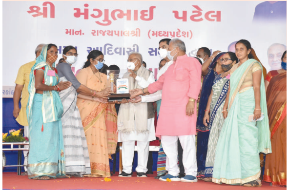
શ્રી મંગુભાઈ પટેલ માન. રાજ્યપાલશ્રી (મધ્યપ્રદેશ) આદિવાસી સમાજને આશીર્વાદ આપી રહ્યા છે.

નિવાસી શાળાઓ આદિજાતિ વિસ્તારોમાં શરૂ કરીને ઘર આંગણે ગુણવત્તાયુક્ત શિક્ષણ આપવામાં આવે છે. અને આજે આદિજાતિ લોકોમાં ૬૪ ટકા શિક્ષણ સ્તર પહોંચ્યું છે. તેવા વિઝનરી તત્કાલીન મુખ્યમંત્રીશ્રી અને હાલના દેશના વડાપ્રધાન શ્રી નરેન્દ્રભાઈ મોદીને ફાળે જાય છે. હું તેમને રાજનીતિમાં આવ્યા તે પહેલા ૧૯૬૨-૬૩થી ઓળખું