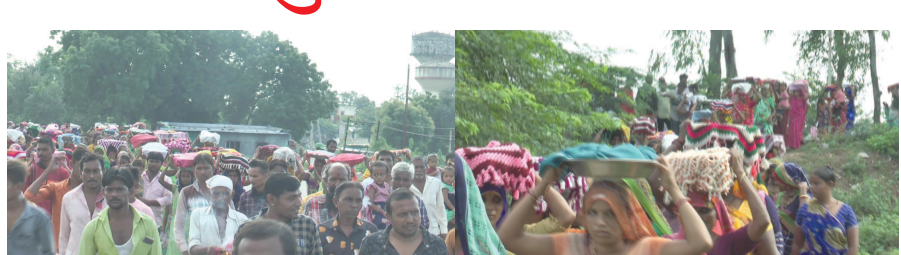
પશુ રક્ષણ માટે વર્ષમાં એક વખત ભગિચાદેવની ભાદા કરે છે : આ દિવસે પશુ નું દૂધનું વિતરણ કરવામાં આવતું નથી : વર્ષોથી ચાલી આવતી પરમપરા આજે પણ યંત્ર યુગમાં પણ યથાવત

પ્રાંતિજ તા. ૧૪ સાબરકાંઠા જિલ્લા ના પ્રાંતિજ ખાતે રહેતા ક્ષત્રિય સમાજ દ્વારા અણ્જા પાડવામાં આવ્યા હતાં જેમા પશુઓના રક્ષણ માટે વર્ષ માં એક વખત ભગિચા દેવની બાધા આજે પણ કરવામાં આવે છે જે વર્ષો થી ચાલી આવતી પરમપરા આજે પણ યંત્ર યુગમાં પણ યથાવત છે. પ્રાંતિજ નાની ભાગોળ મોટા વાસ, નાનાવાસ, આંબલિયા વાસ, જાંબુ વાસ ખાતે રહેતા ક્ષત્રિય સમાજના ભાઈ- બહેનો દ્વારા ભગિચા દેવના મંદિર ખાતે આજે વર્ષો થી ચાલી આવતી પરમપરા મુજબ પોતાના પશુઓની તંદુરસ્તી માટે એક દિવસ માટે અણ્જા પાડવા આવે છે જેમાં પશુ દુધનું વિતરણ કરવામાં આવતું નથી અને નાનાથી મોટા મહિલાઓ સહિત કુલેર, ઉધના ટોડા ભુંદી જેવી પ્રસાદ લઈને નેશનલ હાઈવે આઈ ઉપર આવેલ ભગિચા દેવના મંદિર ખાતે જઈને ભાધા પૂર્ણ કરવામાં આવે છે અને ત્યાર બાદ પરત આવી બહુચર મંદિર ખાતે ટોળાનું હવન કરવામાં આવે છે અને ક્ષત્રિય સમાજના ભાઈ બહેનો દ્વારા પ્રસાદ લઈ છુટાપડ્યા હતાં.