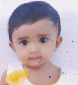
રાજ આરઘ્યા ગા