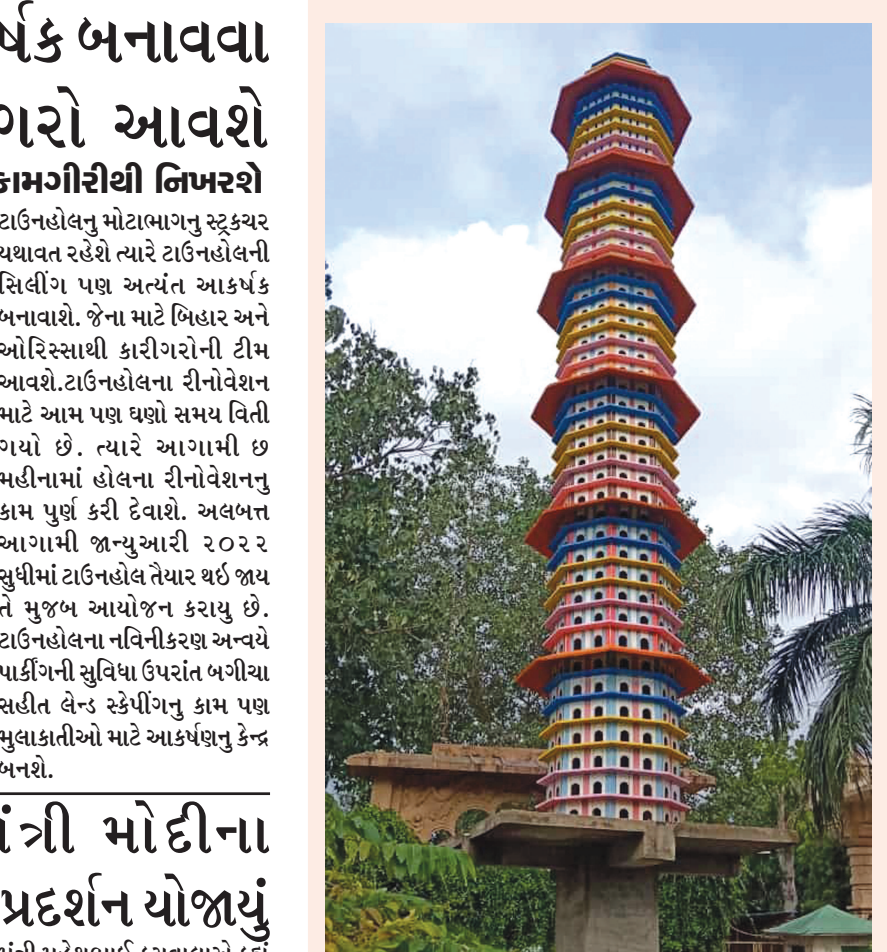
સે-૩૦ સ્થિત અંતિમધામમાં ભવ્ય યજુતરાનું નિર્માણ કરાયું છે. કોર્પોરેશન સંચાલિત મુક્તિધામમાં ૪૮ ફુટ ઉંચા યજુતરો તૈયાર કરાયો છે. જેમાં પશ્ચીમના ૮૦૦ ઘર છે. આ યજુતરો અંદાજિત એક સપ્તાહમાં તૈયાર કરી દેવાયો છે. યજુતરાની ડિઝાઇન પણ લાંબા અભ્યાસના અંતે તૈયાર કરાઈ હતી જે મુજબ અદભુત યજુતરો તૈયાર કરાયો છે. સ્મશાનમાં નિર્મિત આ ઉંચો યજુતરો પશ્ચીમ માટે અનોખું આશ્રય સ્થાન બન્યો છે. રોજબરોજ આવતા પશ્ચીમોને યજ્ઞ અને પાણી મળી રહે છે યજુતરા નિર્માણ બાદ અંતિમધામમાં પશ્ચીમોના કલરવથી પણ સ્વજનોને અનોખી શાંતિનો અહેસાસ થાય છે.