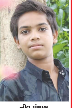
નીવ પંચાલ ભાચક